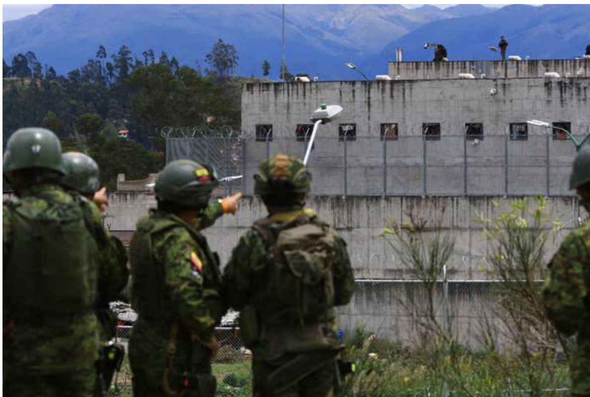
Varios policías vigilan la cárcel de la libertad N.1, en Cuenca, Ecuador.

personas)”. Se ubican en un espacio llamado “Los Malogrados”. La razón: alberga también a internos con tuberculosis o cualquier otra patología contagiosa.