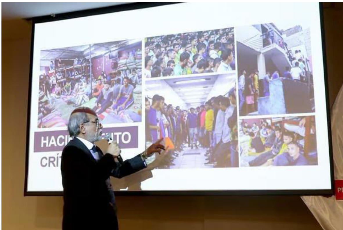
En el Perú se han presentado proyectos para construir más centros penitenciarios. (Foto: INPE).

En Venezuela, donde obtener datos oficiales sobre la situación de las cárceles es misión imposible, es el Observatorio Venezolano de Prisiones el que proporciona información. Para 2020, la población carcelaria era de 32 mil 200, cuando la capacidad máxima es de 20 mil 438. “Las cárceles venezolanas son sinónimo de hambre ante la carencia de alimentos y la reducción de porciones mínimas que no cumplen con las calorías establecidas por la Organización Mundial de Salud”, determinó el Observatorio.