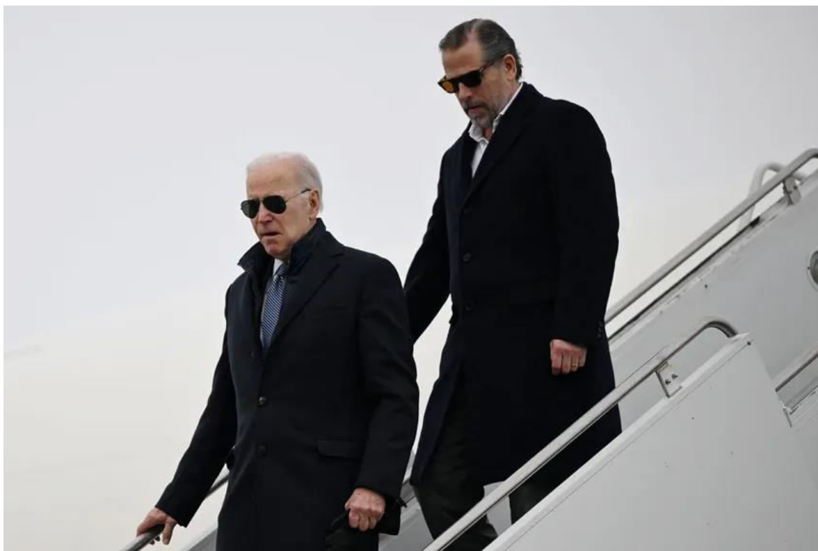
El presidente de Estados Unidos Joe Biden y su hijo, Hunter Biden.