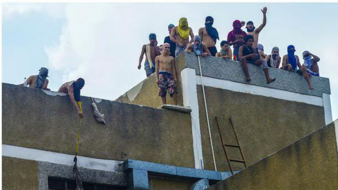
Varios motines han ocurrido en Brasil.

A los motines se suman las extorsiones, que se repiten en prisiones de México a Colombia y Argentina. En Venezuela, una investigación del portal de noticias Runrunes y la plataforma periodística Connectas, que estudió siete prisiones, encontró que desde allí se planifican y controlan “más de una docena de delitos o actividades que generan millones de dólares”.