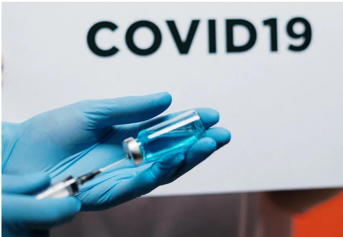
Vacuna contra el COVID-19.

El Departamento de Salud de Florida reportó 1.695 casos de COVID en Miami-Dade entre el 14 y el 20 de julio, el número más alto informado en el estado en esa semana. Esto fue informado por el Diario Las Américas de U.S.A. y lo compartimos con ustedes.