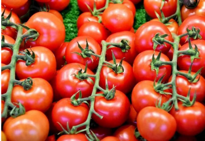
Cosecha de tomates.