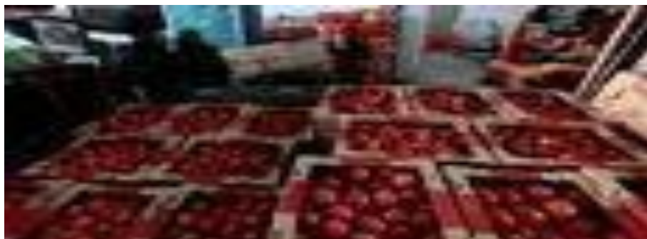
Cajas de tomates en el Mercado Central de Abastos en Guadalajara, Estado de Jalisco, México.

Los productores de tomate en Florida celebran una orden de la administración Trump que da por terminado un acuerdo arancelario previo con México, según artículo del Diario Las Américas de U.S.A que alcanzamos a nuestros lectores.