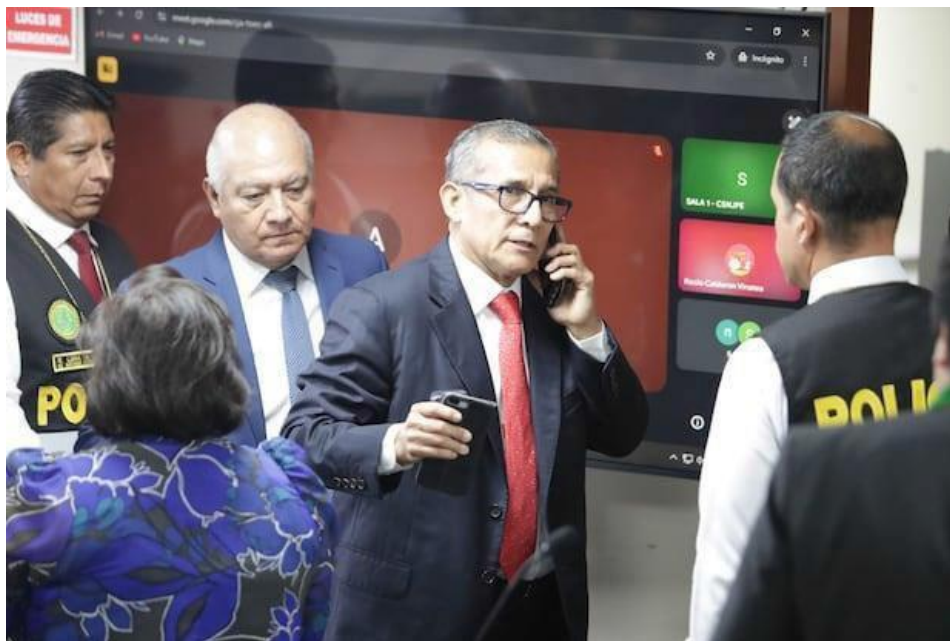
Ollanta Humala realizó una llamada antes de ser detenido por la Policía.

Por la noche, el exmandatario fue trasladado al penal de Barbadillo donde pasó su primera noche.