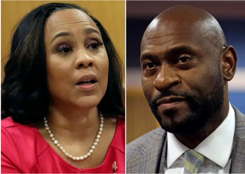
La fiscal del distrito del condado de Fulton, Fani Willis y el exfiscal especial del caso Trump, Nathan Wade.