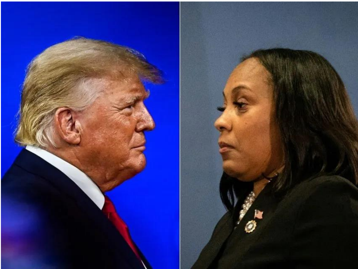
Una combinación de fotos que muestra al presidente Trump y la fiscal Willis

El juicio contra Trump queda paralizado hasta que un panel de jueces decida si la fiscal de distrito del condado de Fulton, Fani Willis, debe ser descalificada, según informó el Diario Las Américas de U.S.A.y que transcribimos para su lectura.