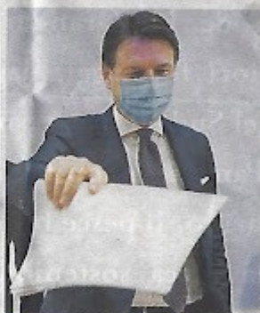
▲ Presidente Il leader del M5S, Giuseppe Conte

"restituzione delle restituzioni". Alcuni parlamentari espulsi si stanno organizzando per intentare un ricorso e richiedere indietro i soldi delle restituzioni versati negli anni passati, 2 mila euro al mese per ogni deputato e senatore, inviati con bonifici trimestrali. Ad oggi ci sono oltre 8 milioni di euro accumulati e che dovrebbero essere destinati ad associazioni come Emergency e piccole e