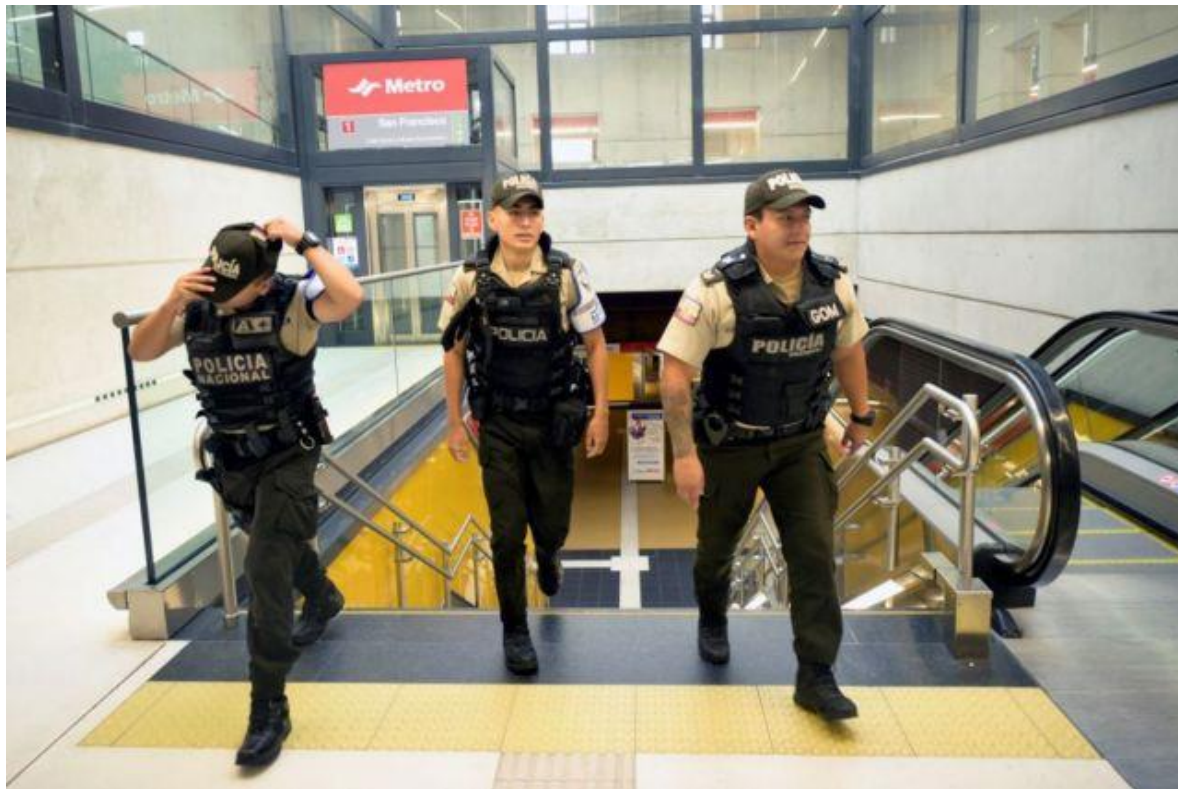
Agentes de la Policía Nacional de Ecuador patrullando la estación de metro de San Francisco en Quito, el 10 de enero de 2024.

“Este y otros crímenes son para ponerle condiciones al poder político y demostrar que desde hace algún tiempo, en buena medida, las bandas son quienes tienen el control en el país”, le dijo a BBC Mundo el analista político ecuatoriano Andrés Chiriboga.