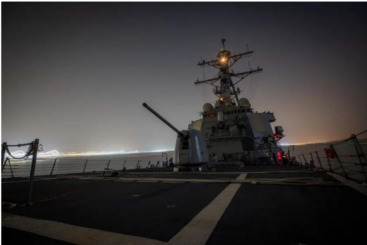
En esta imagen obtenida del Departamento de Defensa de EEUU, el destructor de misiles Arleigh Burke USS Carney transita por el Canal de Suez el 26 de noviembre de 2023. El 16 de

El incidente había sido confirmado a la AP por un funcionario de seguridad privada. El ataque fue reportado en primer lugar por la cadena libanesa Al-Mayadeen, afiliada políticamente a Hezbollah y que ya anunció otros ataques vinculados a Teherán en la región. Irán no ha reivindicado su autoría.