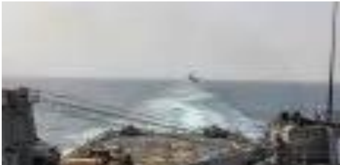
Los buques de asalto anfibio USS Carter Hall y USS Bataan navegan por el estrecho de Bab el Mandeb.

Desde el inicio de los ataques en noviembre, los hutíes han alcanzado buques con una vinculación escasa o dudosa con Israel, alterando la navegación en una ruta clave para el comercio mundial.