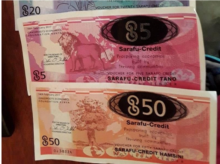
Papel moneda utilizado antes de la “pandemia”

Los intentos de fraude o ahorros excesivos se evitan mediante tarifas y regulaciones que obligan a la circulación de tokens «Sarafu» dentro de la comunidad. Y se otorgan bonificaciones a los comerciantes más activos.