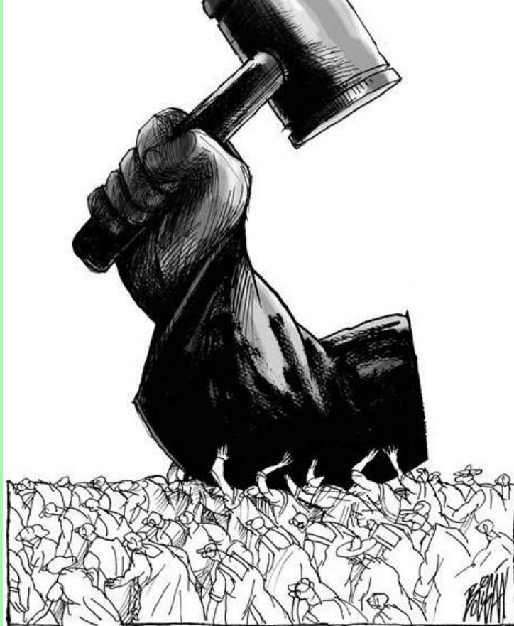
La ley era entendida, como sucede hoy, para dominar a los demás.

El sábado se hizo para el hombre, y no el hombre para el sábado (Mc 2, 27). Los escribas habían convertido el sábado, como tantas otras leyes, en una carga insoportable. Empleaban el sábado contra el hombre, en lugar de emplearlo en favor del hombre. En su opinión, se suponía que la ley debía ser un yugo, una «penitencia», una medida opresora; mientras que, para Jesús, debería estar en beneficio del hombre, para servir a las necesidades y auténticos intereses del hombre. Tenemos aquí, dos diferentes actitudes ante la ley, distintas opiniones acerca de su finalidad y, consiguientemente, dos diversas formas de usarla. La actitud de los escribas conducía a la casuística, al legalismo, a la hipocresía y al dolor. La actitud de Jesús, por el contrario, conducía a la tolerancia cuando las necesidades del hombre