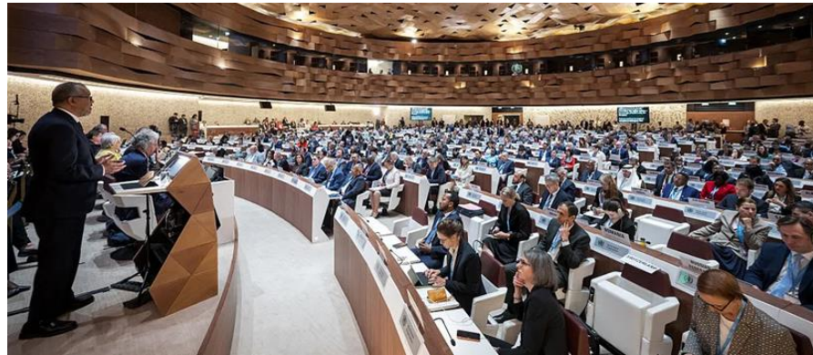
78ª Asamblea de la OMS, en Ginebra, Suiza, del 19 al 27 de mayo

No es un secreto que las pandemias forman