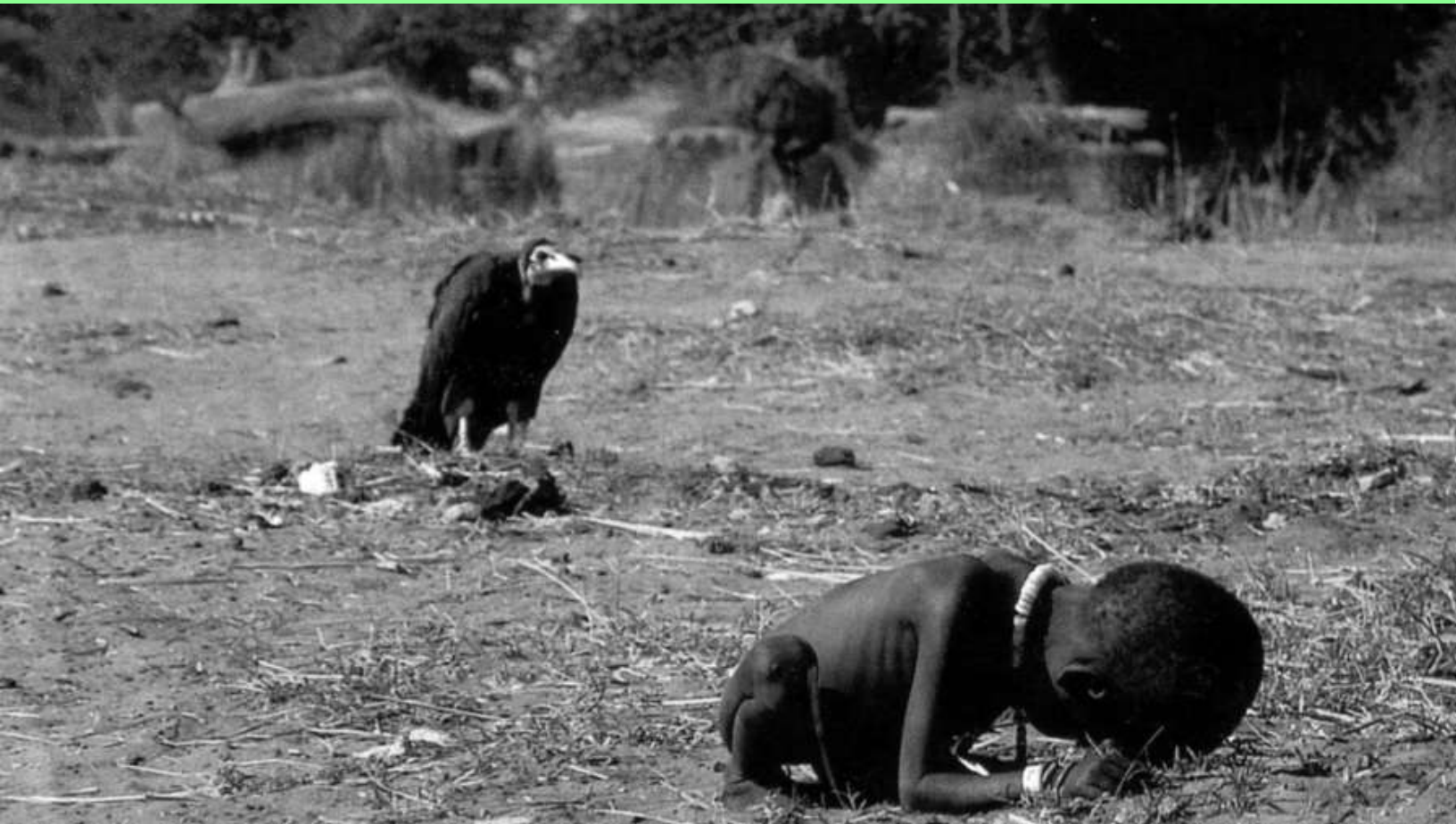
Cero status: niña a merced de un buitre

El amor de Jesús a los pobres y oprimidos no era un amor excluyente; pero sí era un indicio de que lo que Jesús valoraba era la humanidad, no el «status» y el prestigio. Los pobres y oprimidos no tenían otra cosa digna de elogio sino su humanidad y sus sufrimientos. Jesús también se interesaba por las clases medias y