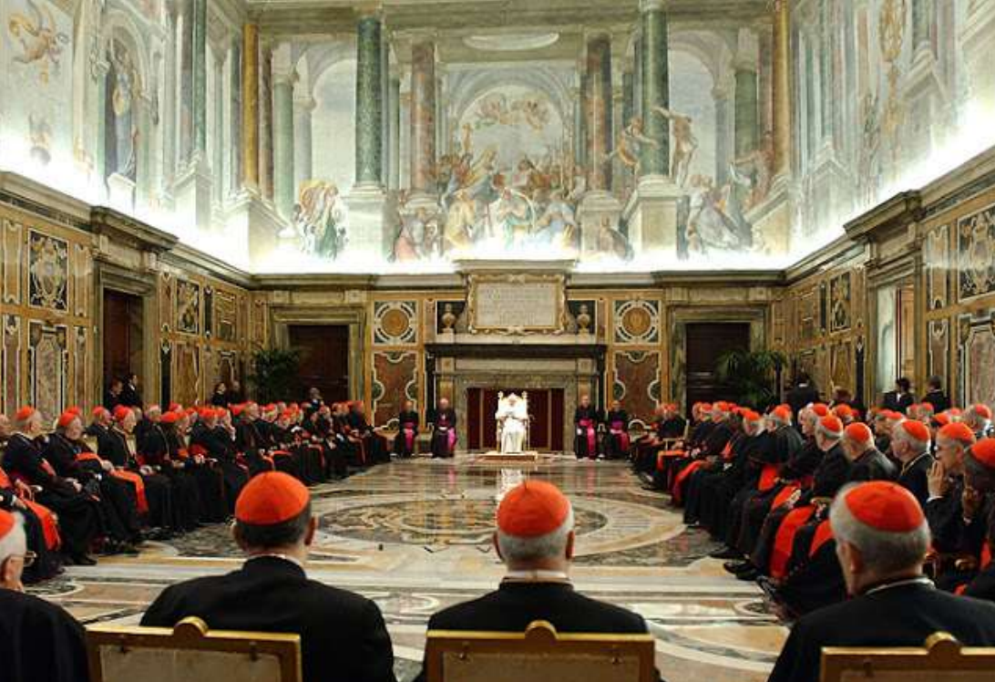
La riqueza del Vaticano podría acabar con la pobreza del mundo 2 veces. Caos en la red

altas, no porque fueran personas especialmente importantes, sino porque también eran personas. El deseaba que se despojaran de sus falsos valores, de su riqueza y su prestigio, para hacerse verdaderas personas. Jesús pretendía sustituir el valor «mundano» del prestigio por el valor «divino» de la persona como persona.