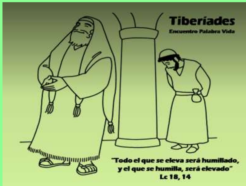
Jesús salió en defensa de los más vulnerables.

El llamó a un chiquillo, lo puso en medio y dijo: