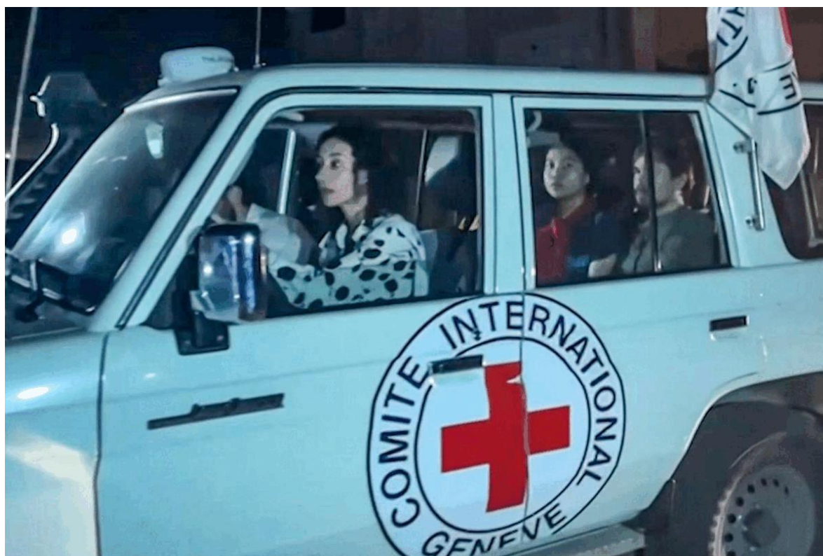
Intercambio de rehenes entre Hamás e Israel.

La difícil situación de las cerca de 240 personas secuestradas durante el ataque de Hamás ha conmocionado a Israel, según nota del Diario Las Américas de U.S.A. que compartimos con ustedes.