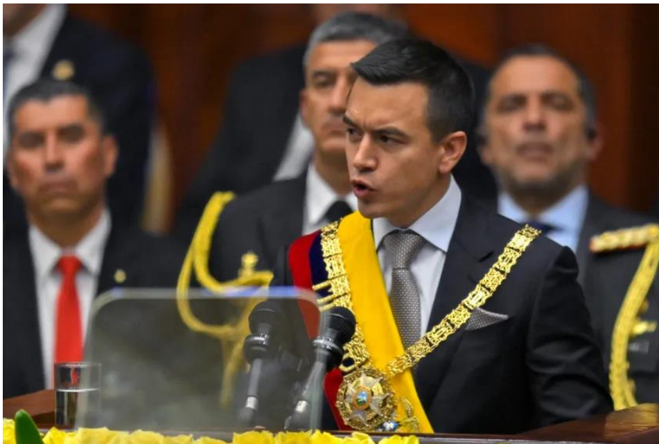
El nuevo presidente de Ecuador, Daniel Noboa.

Cuando la ceremonia estaba en proceso arribó a la Asamblea el presidente de Colombia, Gustavo Petro, el único mandatario que estuvo presente, y se unió a los vicepresidentes de Brasil y de Honduras, entre otros invitados internacionales de menor jerarquía.