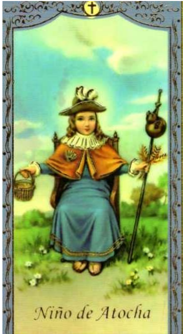
Niño Dios de Atocha