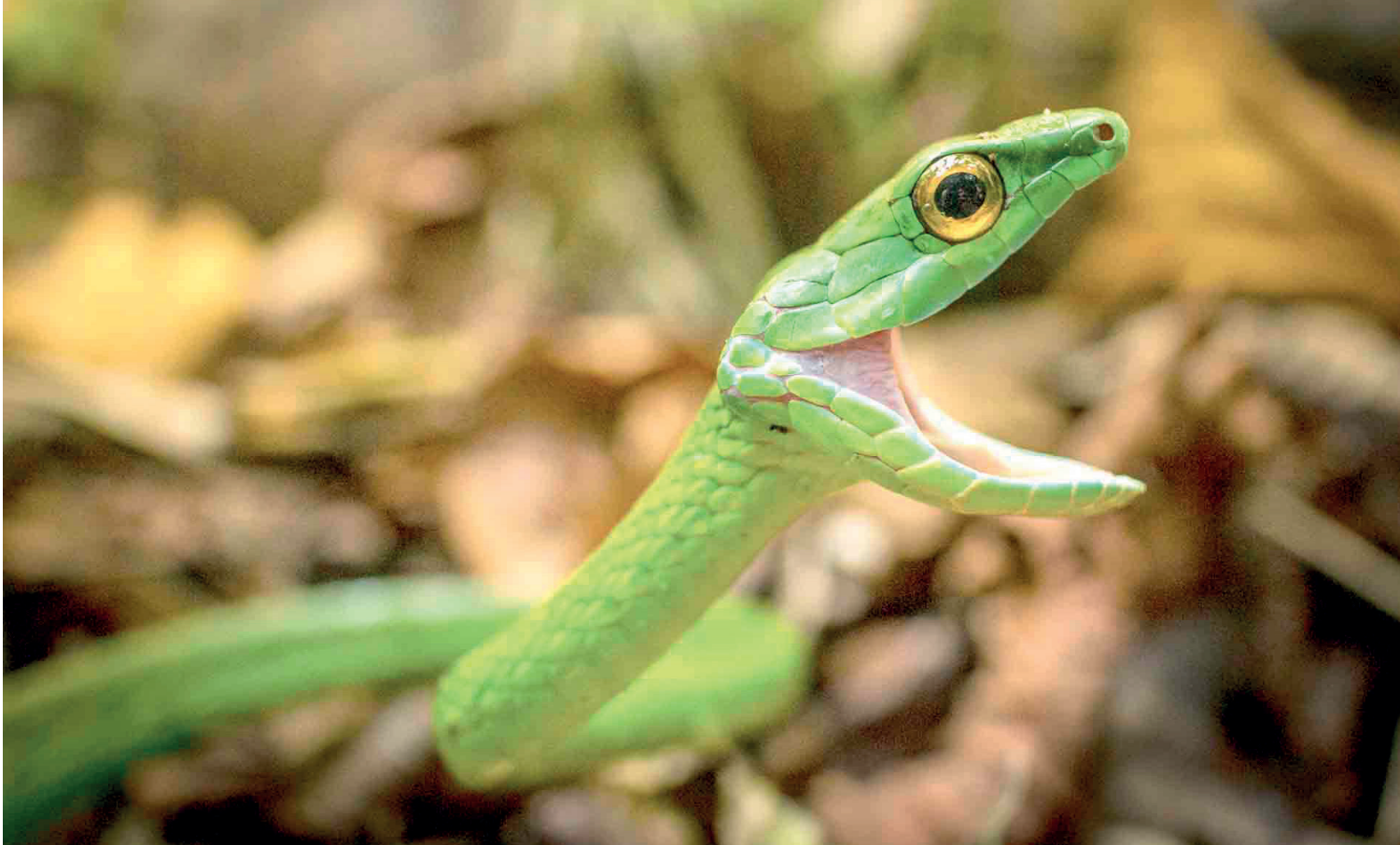
Serpiente lora, Los Chimalapas, Oaxaca.