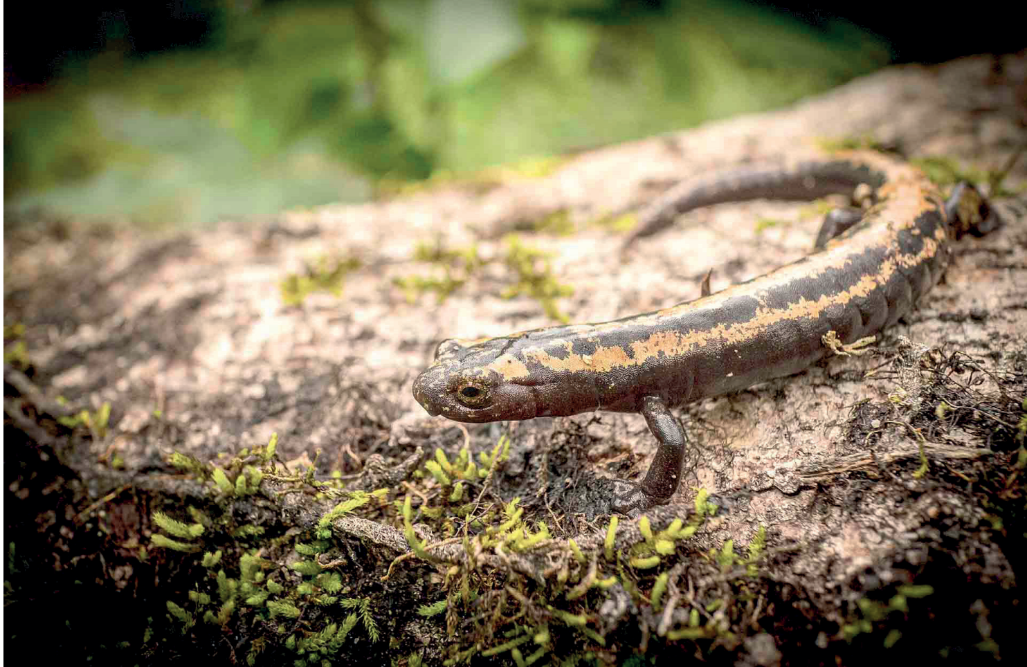
Salamandra lengua de hongo mexicana ( Bolitoglossa mexicana ), Santa María Chimalapa, Oaxaca.