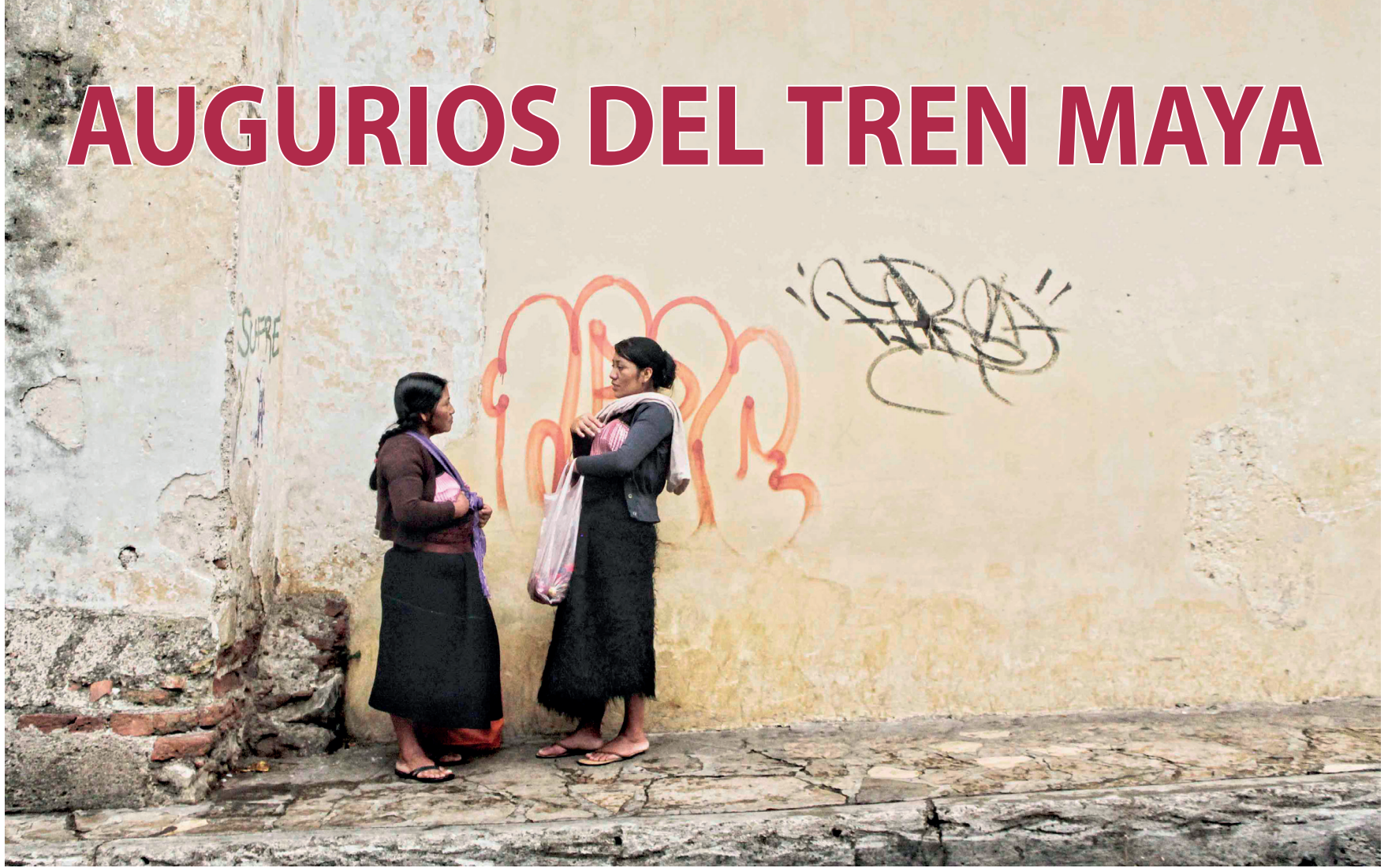
Mujeres tsotsiles, San Cristóbal de Las Casas, Chiapas.