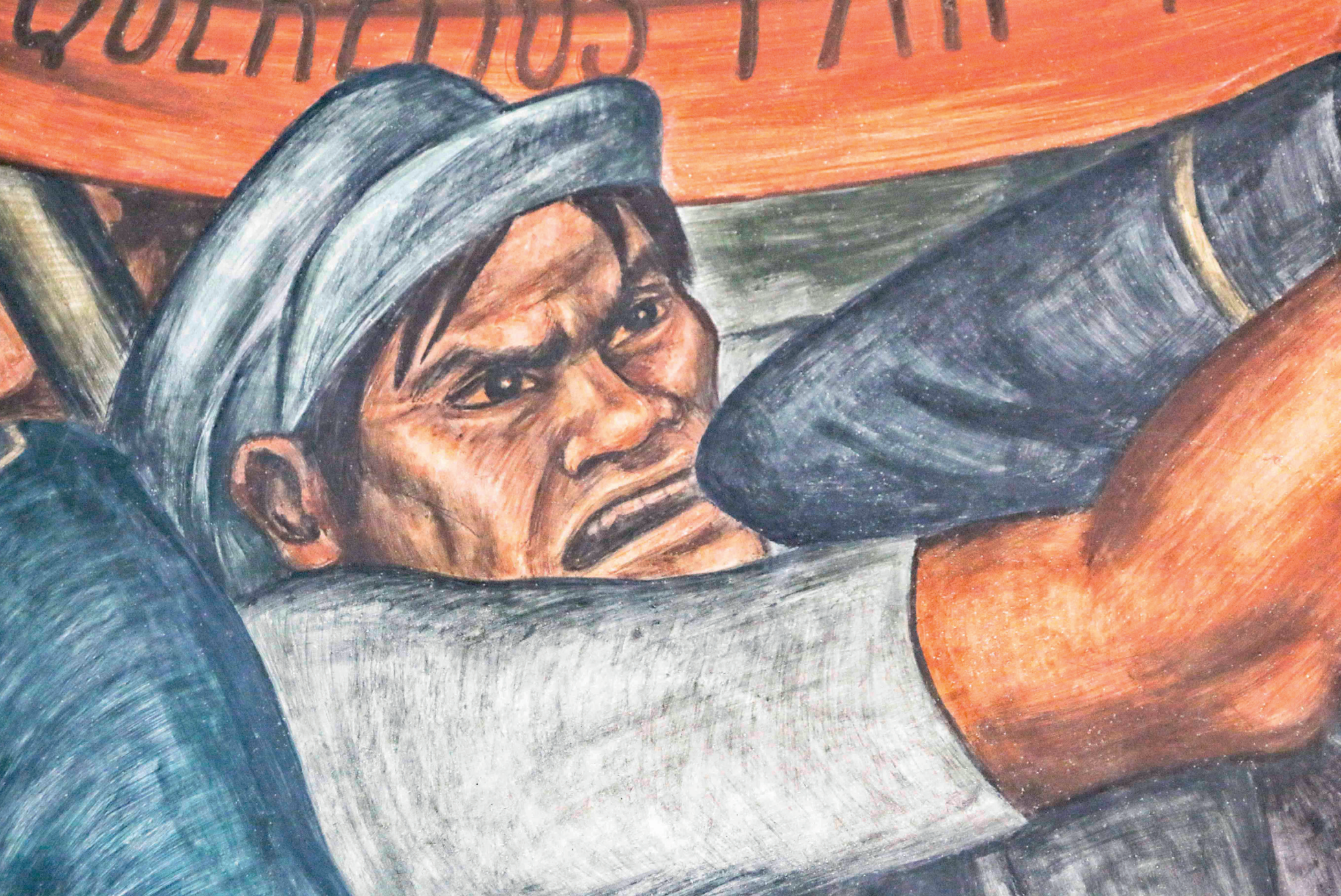
La industrialización del campo (detalle), 1935, mural de Grace Greenwood. Mercado Abelardo Rodríguez, CDMX.