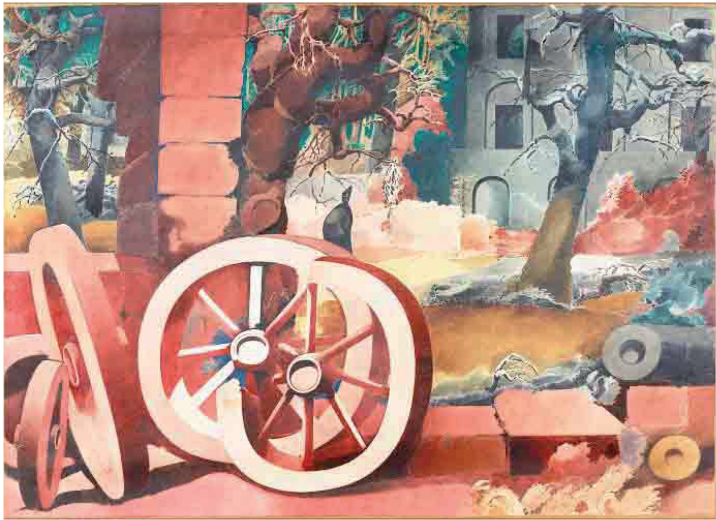
Paisaje con ruedas rojas. Óleo de Edward Burra

hago en hojas de papel, en pedazos recogidos en las calles, en tickets de buses, o en alguna esquina en blanco de cualquier periódico. Amontonando estas cosas, a veces forman un libro. Una vez escrito el texto lo dejo reposar. Cuando vuelvo a encontrarme con él, veo que tiene demasiadas palabras; entonces comienzo a desvestirlo, hasta dejarlo con la desnudez de un recién nacido. Otras veces me ocurre lo contrario; me brota la idea y necesito vestirla, así que le voy probando una y otra palabra, hasta dejarla, según yo, como debe quedar vestida. No siempre quedo satisfecho, siento que algo le falta y esa insatisfacción me angustia. En la confección de mis poemas, echo mano de tres recursos. Uno es el lenguaje directo: planteo un cuadro. Otro, las metáforas y las imágenes. Y cuando siento que las palabras no son capaces de darle cuerpo a lo que quisiera, recorro a la onomatopeya, de la que está salpicada la lengua de mis abuelos; porque éste es un lenguaje que no va a los sentidos sino al espíritu, en un intento de trasladar el sonido natural a las hojas de papel. Caminar por este camino me ha abierto más