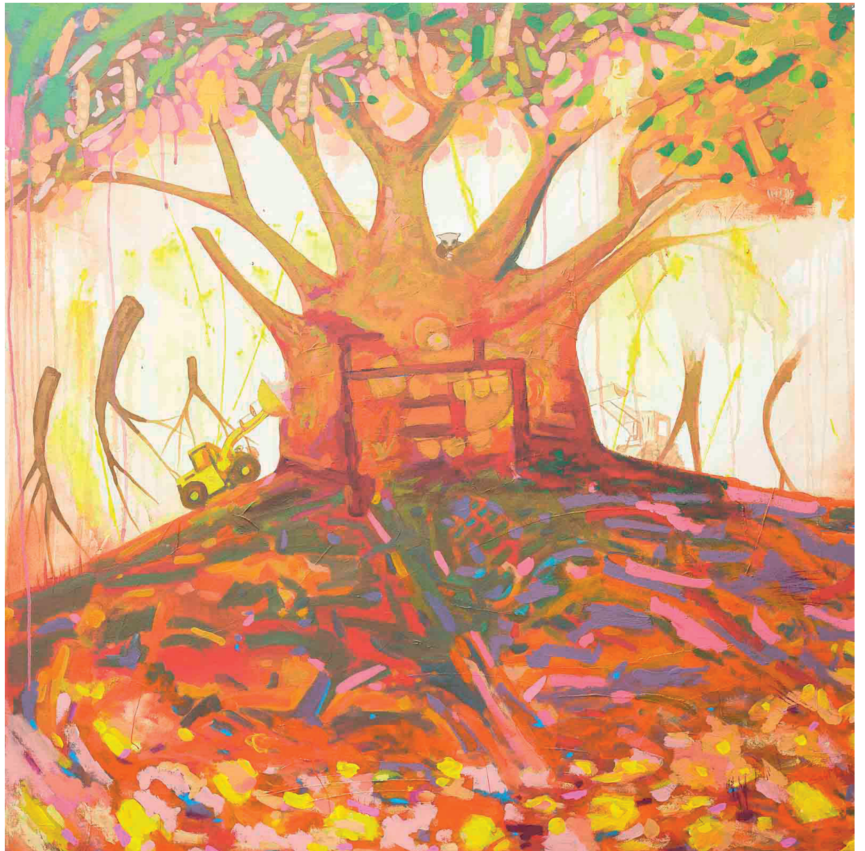
Extractivismo (detalle). Pintura de Saúl Kak

Para los científicos de ciencias naturales, el trópico es una región que conjuga altas temperaturas con alta humedad que producen mucha y muy diversa vegetación y fauna, que básicamente se relacionan con condiciones cercanas al ecuador, pero sobre todo en la zona comprendida entre las líneas imaginarias llamadas trópicos, al norte el de Cáncer y al sur el de Capricornio. Hay que recordar, sin embargo, que