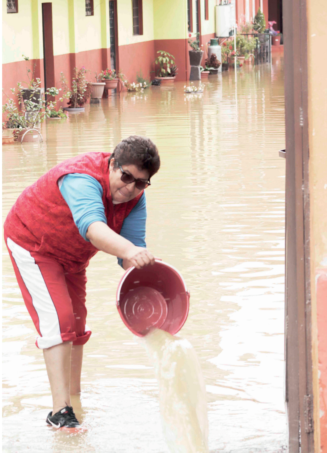
Inundación en San Cristóbal de Las Casas, Chiapas, octubre de 2020.