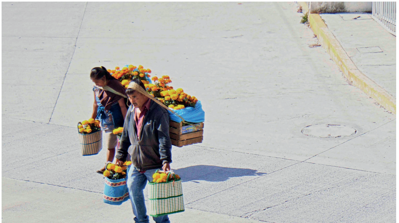
Desde el balcón de la casa de mis padres, noviembre 2020.

La conformación de las comunidades indígenas ubicadas al poniente de Bacalar, Quintana Roo, ha sido un proceso largo con una carga histórica que configura su propia identidad, su filosofía, su organización y sus prácticas culturales y espirituales. Esto es resultado de un tejido colectivo donde se van develando acuerdos al interior de