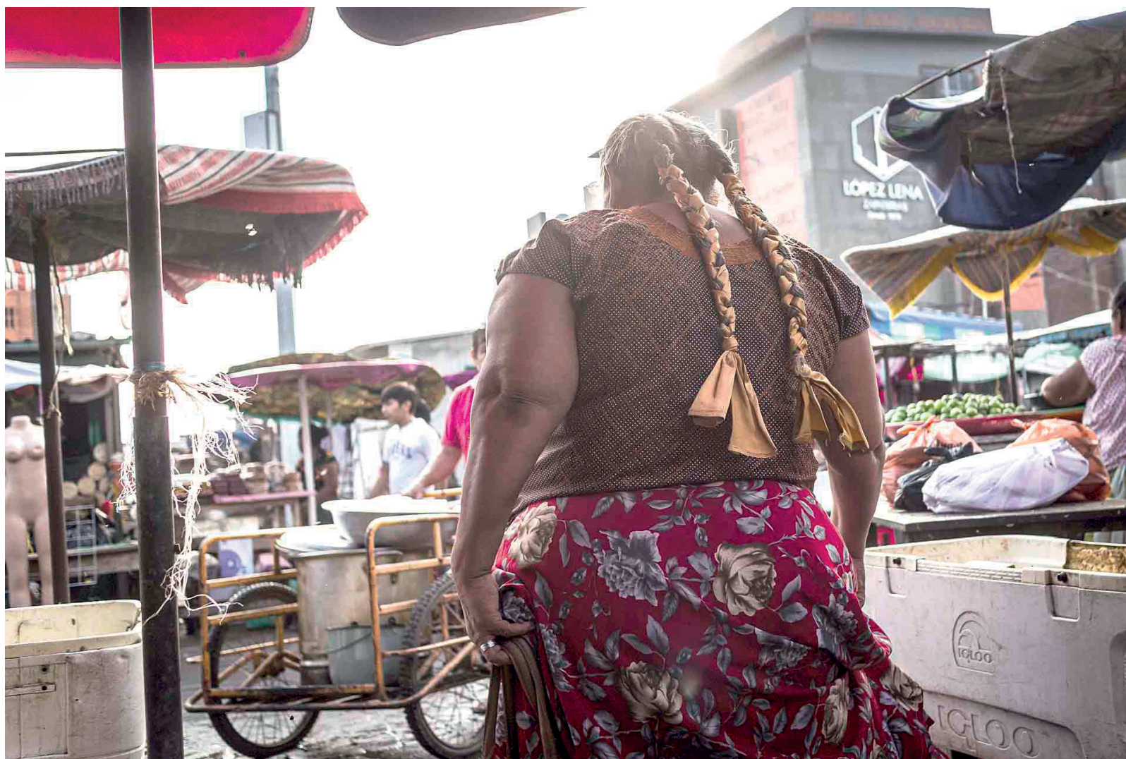
Juchitán de Zaragoza, Oaxaca.