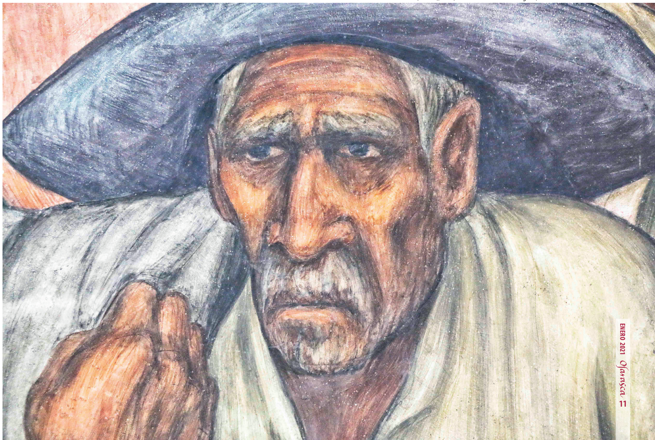
Mural de Marion Greenwood (detalle), 1935, mercado Abelardo Rodríguez, CDMX.