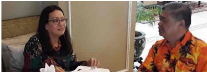
Mr. Mat Sabu, ministro de Defensa de Malasia

Como está sucediendo en todo el mundo, en Malasia también se pronuncian los grupos sociales, partidos políticos, personalidades diplomáticas y la sociedad malasia en general a favor de la paz, la autodeterminación de los pueblos, el respeto al derecho internacional y a la Carta de las Naciones Unidas.