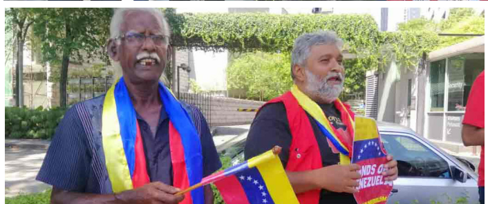
Dirigentes y militantes del Partido Socialista de Malasia