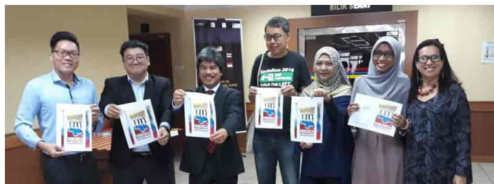
Estudiantes y profesores de la Universidad de Malasia

LA CAMPAÑA MUNDIAL DE SOLIDARIDAD CON VENEZUELA CONTINÚA Y EL SÁBADO 16 DE MARZO LOS PUEBLOS DEL MUNDO SALIERON A LAS CALLES PARA PROTESTAR LA INJERENCIA DE DONALD TRUMP EN LA VIDA POLÍTICA DE ESA NACIÓN Y MOSTRAR SU FIRME OPOSICIÓN A UNA POSIBLE GUERRA DE ESTADOS UNIDOS EN VENEZUELA