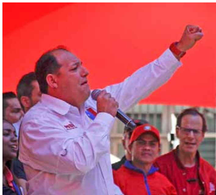
En palabras del ministro, el atentado despejó dudas sobre la guerra contra Venezuela

Durante su participación en la Tribuna Antiimperialista instalada en Puente Llaguno con la participación de representantes del sector universitario, Roa expresó: “Aquí tenemos que aprender cómo enfrentar los bloqueos, cómo llegar a hacer nuestras medicinas esenciales, y esta crisis aceleró ese proceso”.