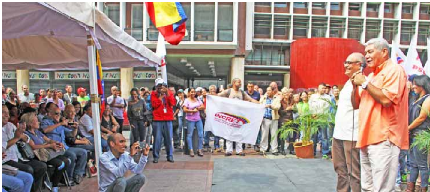
El sector opositor “esperaba una gran mortandad”, aseguró el ministro Alvarado

El Ejecutivo Nacional tenía conciencia de un posible ataque al sistema eléctrico, y con mucha anterioridad giró instrucciones para que todos los hospitales del país hicieran mantenimiento de las plantas eléctricas a fin de que estuvieran operativas