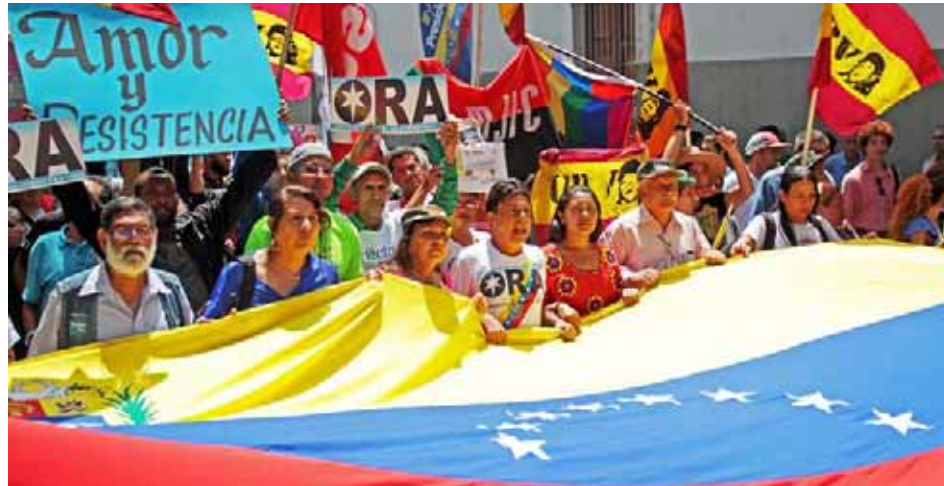
Que indaguen sobre la verdad del pueblo venezolano solicitan los movimientos sociales