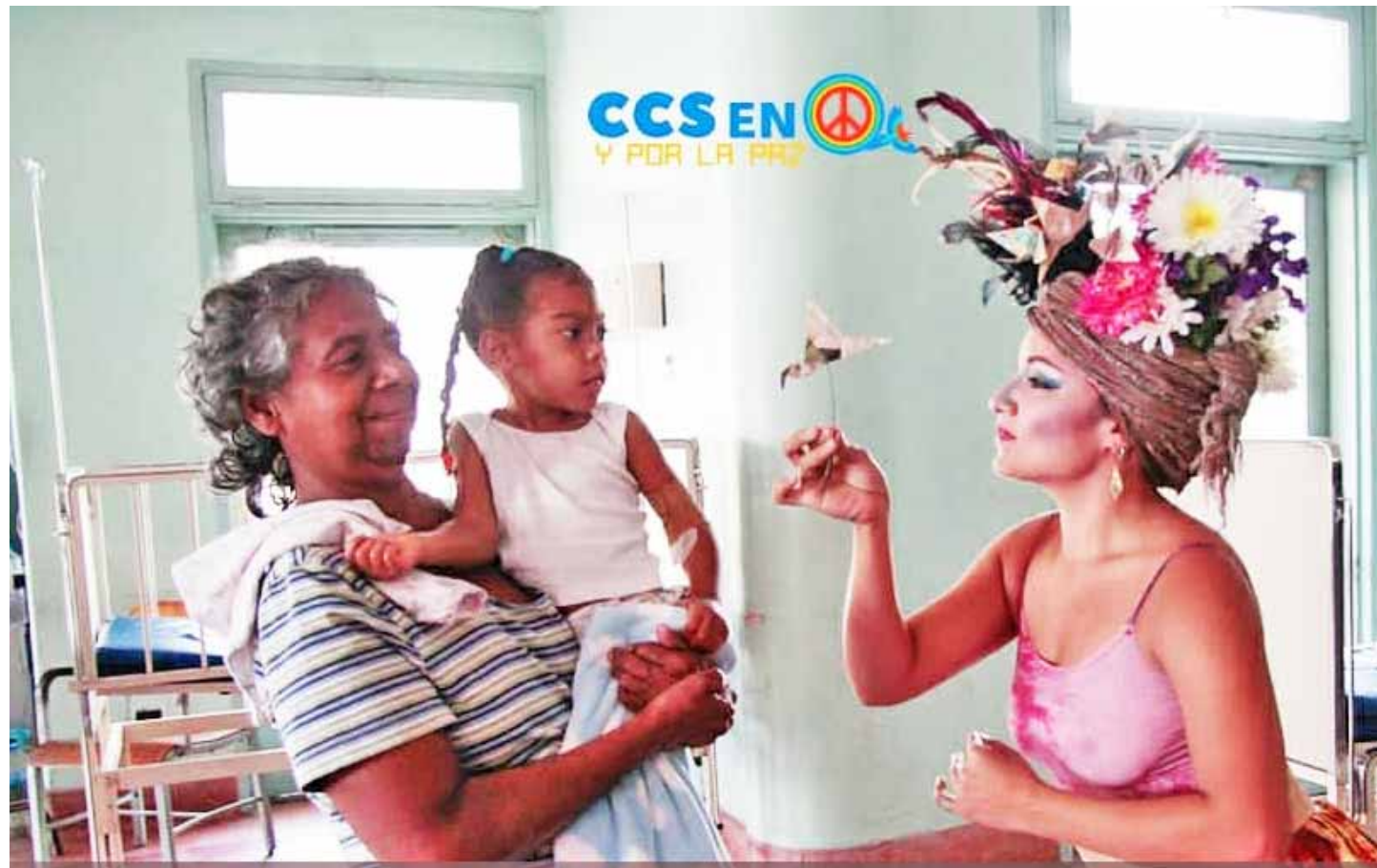
Se espera que esta acción se convierta en una política constante de ahora en más

Godoy especificó que desde el pasado domingo 10 de marzo iniciaron un recorrido por los 16 hospitales y 39 CDI (Centros de Diagnóstico Integral) que hay en Caracas para llevar a usuarias, usuarios, familiares, trabajadoras y tra-