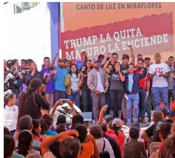
Sector universitario ratificó su solidaridad con el presidente Nicolás Maduro

A la cita asistieron todas las instancias del Ministerio del Poder Popular para la Educación Universitaria, Ciencia y Tecnología, lideradas por el ministro Hugbel Roa, quien, al inicio de su intervención destacó la labor fundamental de las trabajadoras y los trabajadores de Corpoelec y de Cantv en la recuperación del servicio y de comunicaciones a escala nacional.