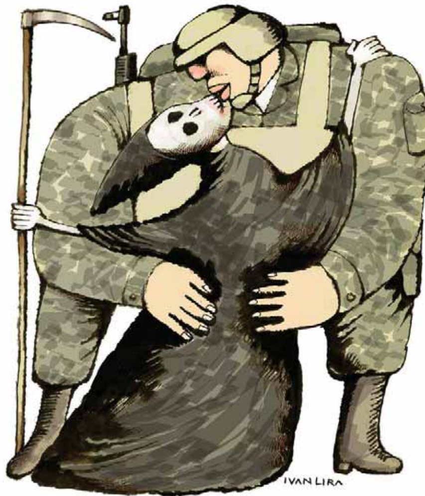
Trazos de Iván Lira