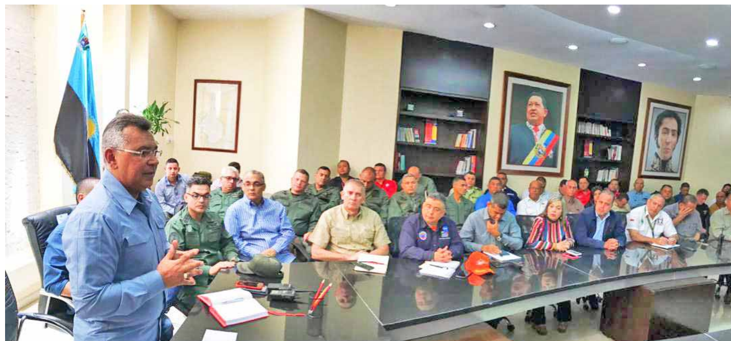
Reverol destacó que se ha reunido con productores agrícolas para garantizar la alimentación de los zulianos

Destacó además que el presidente de la República, Nicolás Maduro, solicitó a la banca pública que otorgue créditos especiales a los 102 comerciantes que fueron víctimas del vandalismo y las guarimbas durante el criminal ataque al Sistema Eléctrico Nacional que dejó sin energía gran parte del te-