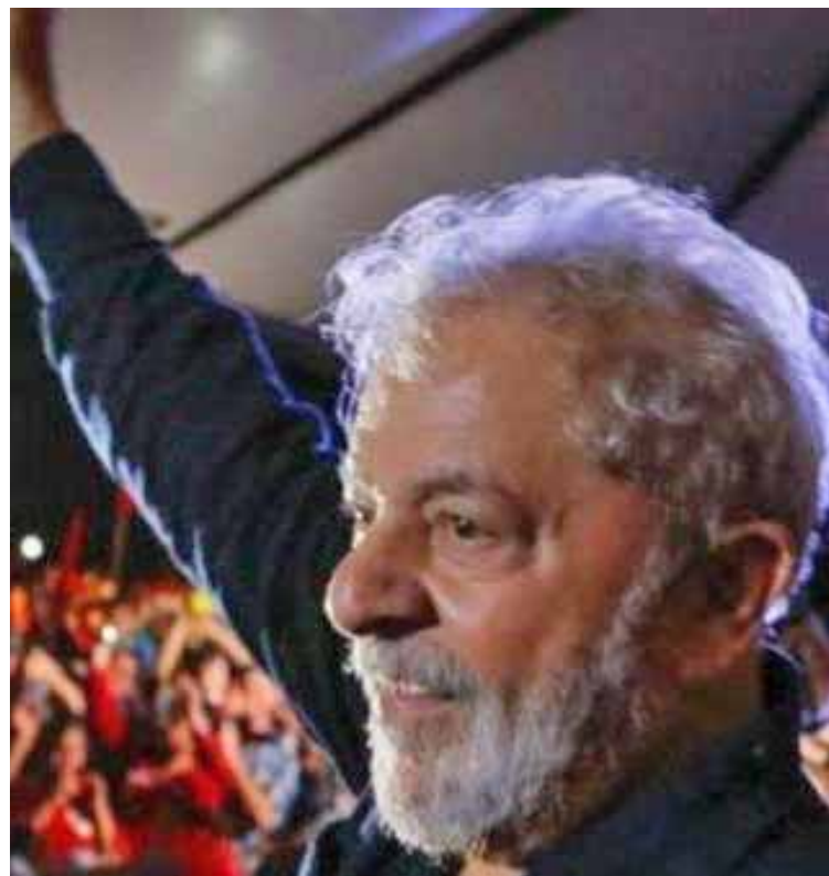
Lula permanece preso desde abril de 2018

Además, acotó que “la AFL-CIO se une al Comité de Derechos Humanos de las Naciones Unidas para pedir el restablecimiento de todos los derechos políticos de Lula”.