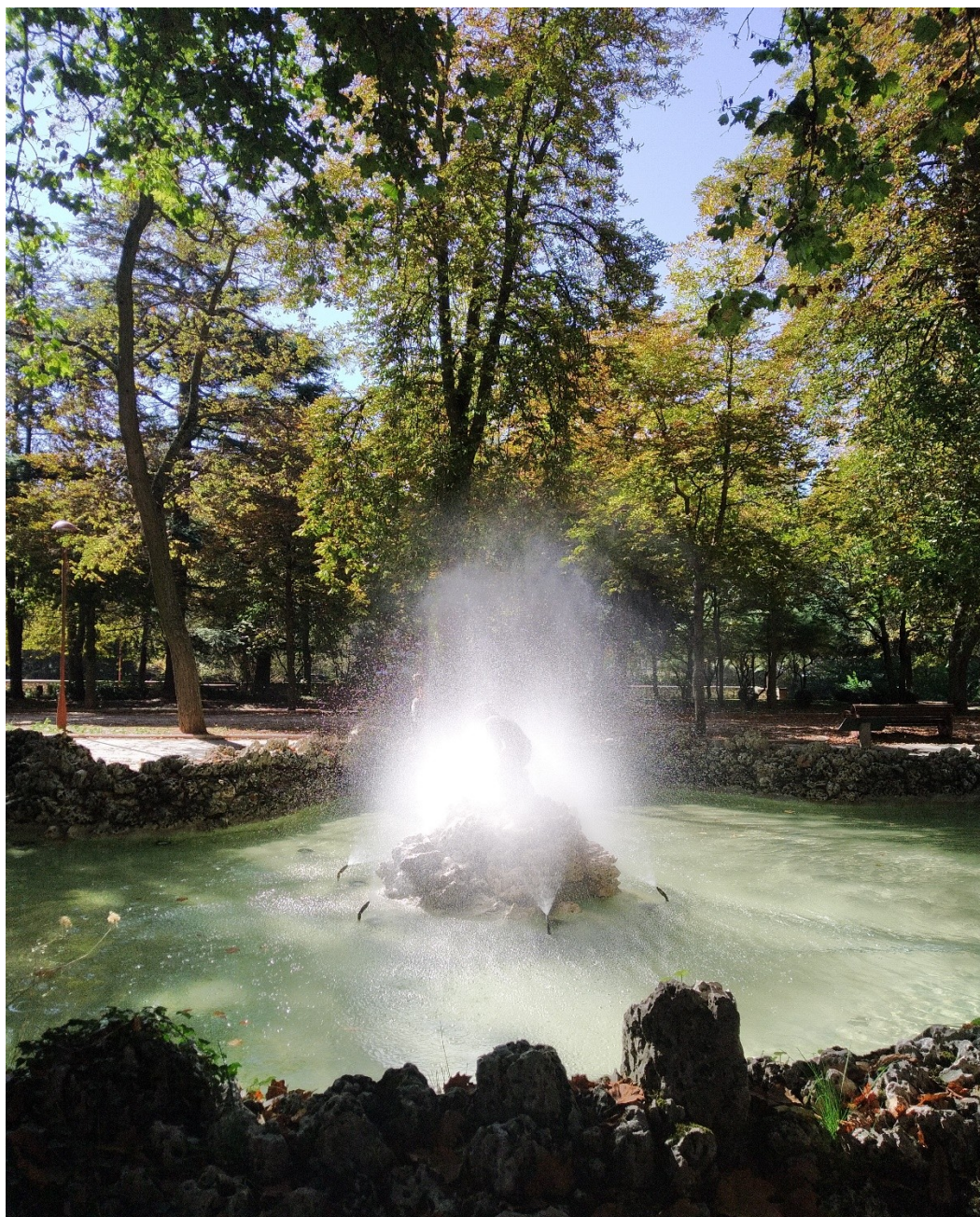
DANIEL DE CULLA