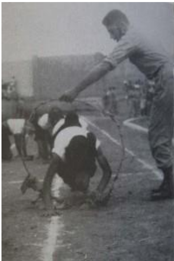
Un “perro” saltando por un aro, en un “bautizo” (p. 48)

Naturalmente, el libro evita mencionar episodios o situaciones que, aunque eran por todos conocidos, no habrían podido incorporarse a la narrativa oficial y celebratoria de la historia del CMLP. Pese a ello, no pudieron dejar de mencionar el “bautizo” a que eran sometidos los nuevos cadetes, es decir, los “perros”. El libro afirma que había sido abolido en 1958 (“El tradicional ‘bautizo’, que año a año se cumplía con los cadetes recién ingresados, no tuvo lugar debido a las disposiciones de la Dirección y así los cadetes del Cuarto Año se quedaron ‘con la miel en los labios’”, p. 58) pero todo indica que, a lo más, lo que se eliminó fue la parte “oficiosa” del bautizo pero se mantuvo la costumbre de infligir a los “perros” por parte de los cadetes más avanzados toda clase de abusos y prácticas humillantes y que, de hecho, duraban mucho más allá de los días de bienvenida al colegio militar. El libro conmemorativo incluyó algunas fotografías debidamente seleccionadas para dar la imagen de un acto juguetón e inofensivo, pero que al mismo tiempo revelan que se trataba de un ritual incorporado a la rutina institucional y, por tanto, aceptado por las autoridades del colegio. Aquí reproduzco esas fotografías, con las leyendas originales: