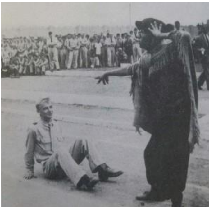
Uno de los últimos “bautizos” (p. 59)