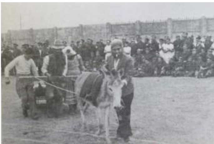
Un número gracioso, también durante uno de los tradicionales “bautizos” (p. 48)