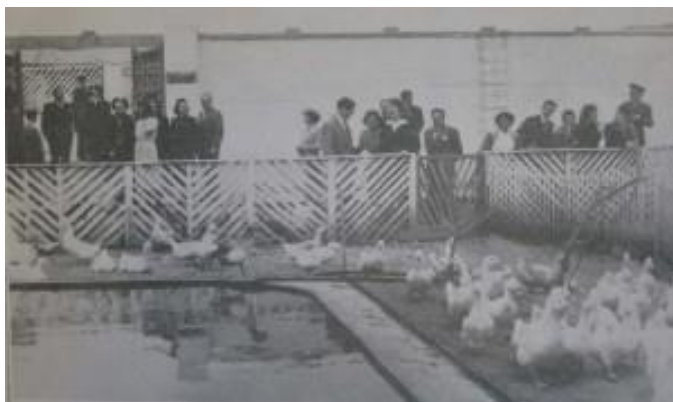
La granja del colegio (p. 244).

como las alas. Tápole el pico, Boa, como si fuera tan fácil. No podía; no te escapes, patita, venga, venga. Le tiene miedo, lo está mirando feo, le muestra el rabo, miren, decía el muy maldito. Pero era verdad que me picoteaba los dedos ( La ciudad y los perros , Seix Barral, 1963, p. 31).