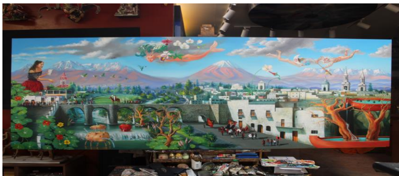
MELGAR...SILVIA ES MÍA Y YO SOY DE ELLA...