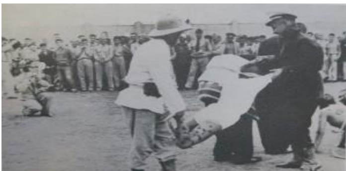
El “bautizo” siempre se recuerda (p. 268).