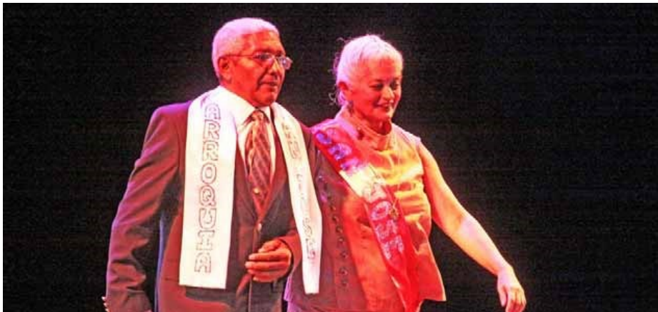
Las personas de la juventud prolongada demostraron que la edad no es obstáculo para pasarla bien

Cabe destacar que hasta el 5 de marzo caraqueñas y caraqueños podrán disfrutar de diversas actividades en parques, plazas y bulevares, y de cuatro conciertos gratuitos que se realizarán en el Parque Alí Primera, bulevar de San Agustín, Parque Hugo Chávez y en Los Próceres. Para mayor información pueden consultar el portal web de la Alcaldía de Caracas.