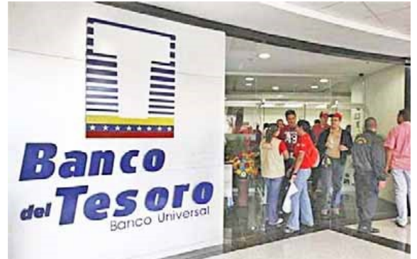
La entidad financiera apoya al pueblo trabajador

El descrito monto muestra un indicador porcentual de 635.095%, en el contraste anual de estos financiamientos; este resultado se confirma en el ascenso de los productos: Tesoro Comunal, que pasó de Bs 59.871,53 a Bs 255.373.427,35 y Credisocial Productivo de Bs 62.403,97 a Bs 130.274.371,27, de esta manera la institución bancaria respalda el Plan de Recu-