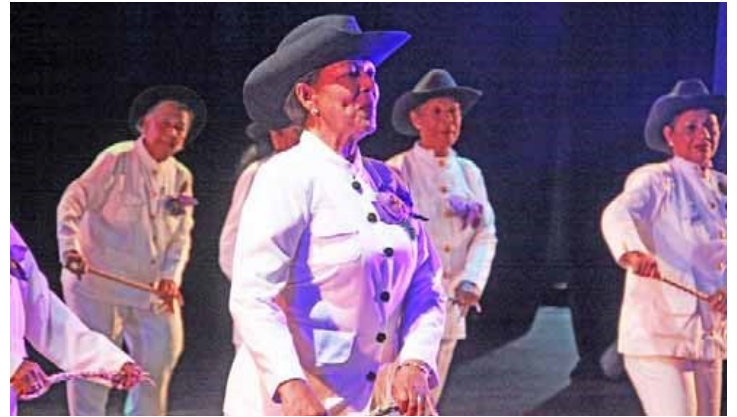
Variados trajes lucieron las 22 parejas que participaron en este evento

El festival recreativo comenzó al son de "Paz, paz, no quiero guerra, queremos paz", cuando las 22 parejas participantes de la juventud prolongada demostraron sus destrezas y habilidades dancísticas con lucidos atuendos