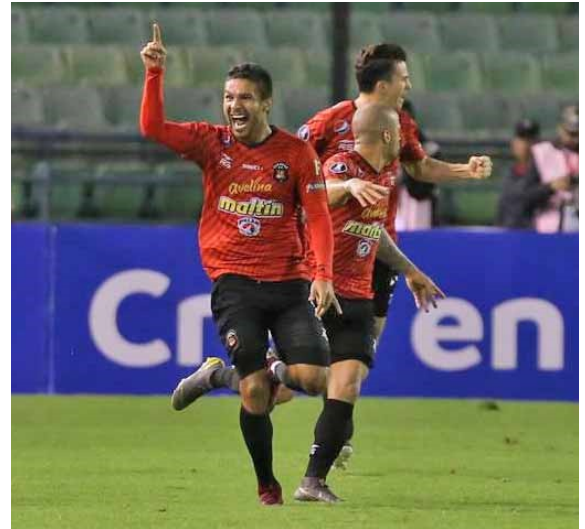
Los rojos del Ávila se metieron por estadísticas

La segunda fase de la Suramericana se jugará desde mayo. En la edición 2018 de este torneo, los rojos del Ávila llegaron hasta octavos de final tras ser eliminados por el campeón del torneo, Atlético Paranaense de Brasil, con un global de 4-1.