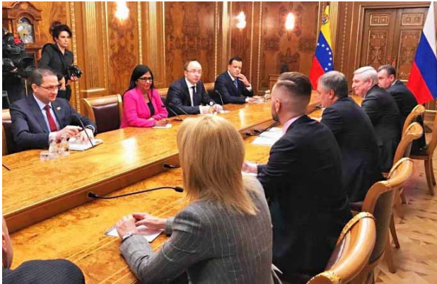
Gira de trabajo en Moscú

De esta manera, la vicepresidenta ejecutiva enfatizó que el jefe del Estado, Nicolás Maduro, se ha encargado de consolidar la expansión de las relaciones entre ambos países hermanos, continuando así con el legado marcado por el comandante eterno Hugo Chávez. “El presidente Maduro ha actuado en consecuencia y nos