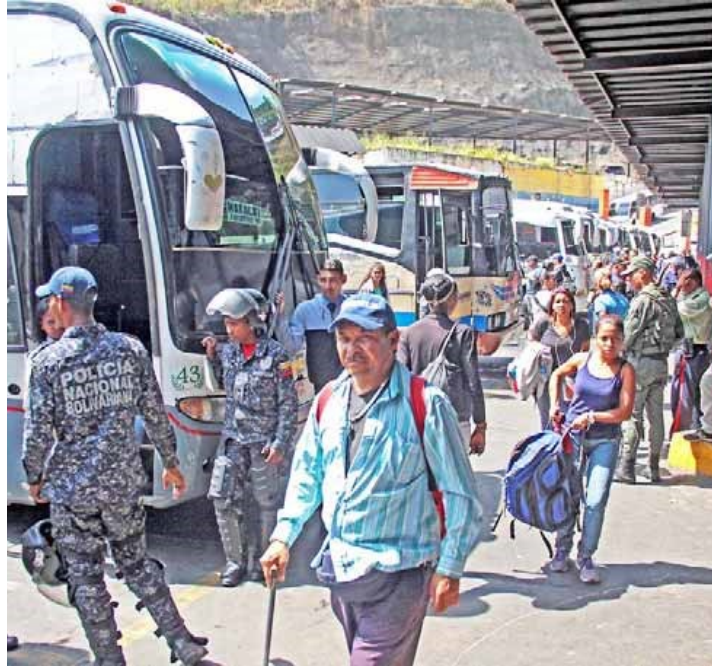
Autoridades garantizarán seguridad en el Terminal la Bandera durante fiestas carnestolendas

Indicó además, que los organismos de prevención del Ministerio del Poder