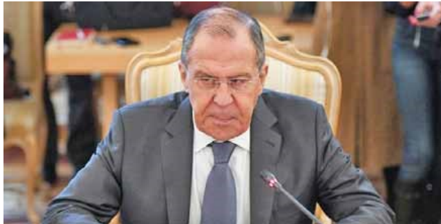
Canciller ruso, Serguéi Lavrov

El canciller de Rusia, Serguéi Lavrov, manifestó que su país está preocupado por los planes de Estados Unidos (EEUU) de armar a la ultraderecha venezolana, así como de las intenciones del imperio estadounidense de invadir el país suramericano.