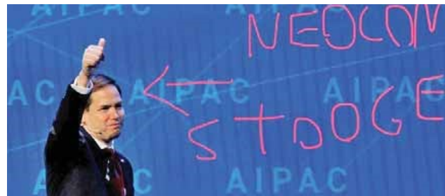
Un ejemplo de las burlas provocadas por el mensaje de Rubio

Las respuestas no se hicieron esperar. Una de ellas fue la del escritor, periodista y bloguero estadounidense Max Blumenthal, que