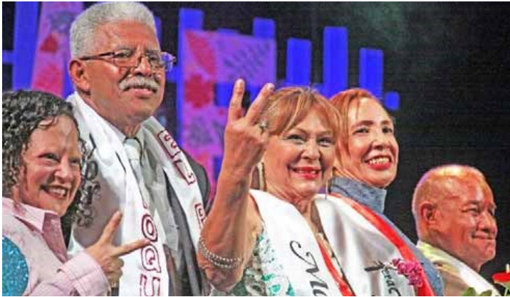
La participante de la parroquia 23 de enero fue electa como Madrina de los Carnavales de Caracas 2019