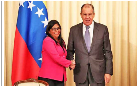
Vicepresidenta Rodríguez con canciller ruso Lavrov

Por su parte, el canciller ruso, Serguéi Lavrov, reafirmó el apoyo de su Gobierno al presidente Nicolás Maduro, rechazó la intervención militar que pretenden aplicar al país latinoamericano y lamentó que la oposición rechace el diálogo.