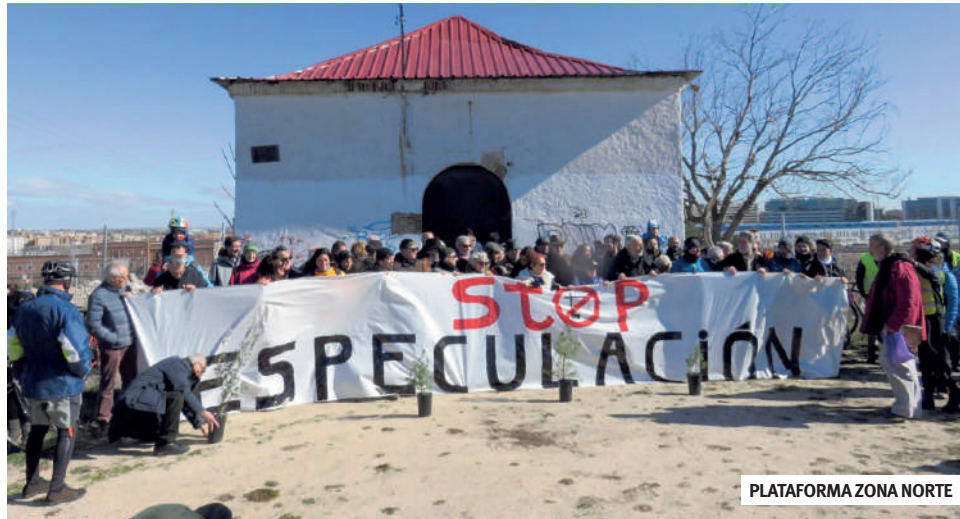
PLATAFORMA ZONA NORTE

Si en mayo de 2016 hubo apoyo unánime del PSOE y de todo Ahora Madrid a Madrid Puerta Norte, la alterna-