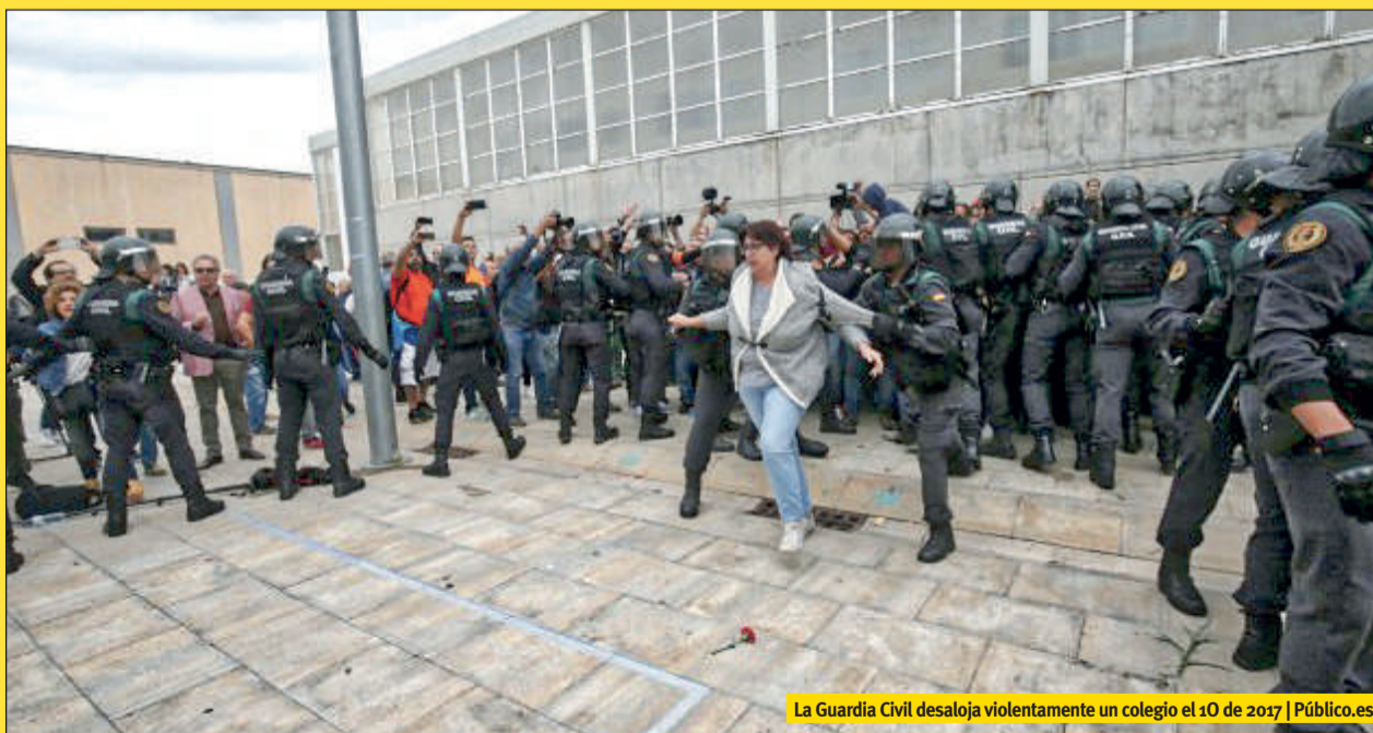
La Guardia Civil desaloja violentamente un colegio el 10 de 2017 | Público.es

A todos nos escandalizaron las imágenes de la Policía Nacional y Guardia Civil del pasado día 1 de octubre en Catalunya cargando contra la gente dispuesta a votar o a permitir la votación. Sobre todo si se la compara con la de los Mossos d'Esquadra, cuya actuación fue en esta ocasión impecable, tanto que