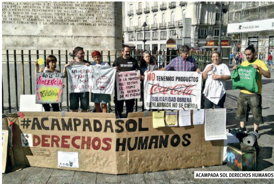
ACAMPADA SOL DERECHOS HUMANOS

tán haciendo otra cosa que reclamar y defender derechos: la PAH el derecho a la vivienda, la Marea Blanca el derecho a la salud, etcétera. La decisión de acampar se ha tomado al advertir que otros derechos fundamentales estaban gravemente amenazados y sobre todo ante las imágenes de represión institucional que llegaban fundamentalmente de Catalunya y Murcia. El incremento de la crispación a causa del proceso catalán y el cuestionamiento que se ha producido a derechos como la libertad de reunión, expresión, manifestación, derecho a decidir... pero, sobre todo, la violencia institucional que se ha ejercido poniendo en peligro el derecho a la integridad física de las personas, en Catalunya en su proceso y en Murcia en relación a las protestas por el soterramiento del AVE; incluida la pasividad o negligencia de los cuerpos de seguridad al no haber actuado para proteger el derecho a la manifestación pacífica en el caso de la manifesta-