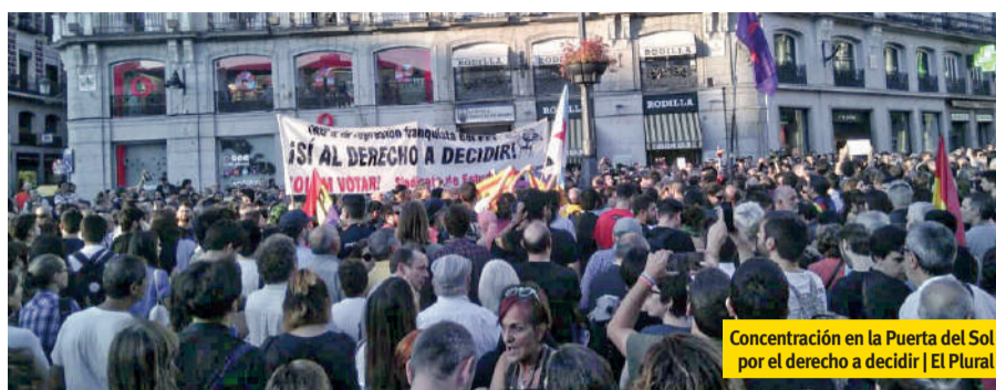
Concentración en la Puerta del Sol por el derecho a decidir | El Plural

Yo soy español, español, español, y por eso quiero un futuro para mis hijas en un país sin enfrentamientos territoriales, sin nacionalismos agresivos, y con respeto democrático a minorías y mayorías, pero también sin desahucios, sin paro estructural y precariedad de por vida, sin desigualdad, trabajadores pobres, fracaso escolar, corrupción, impunidad, fosas comunes, justicia politizada y emigración económica forzosa para los jóvenes. El problema no es Catalunya, el problema es esta España, España, España fallida y necesitada de reseteo para que no se quieran ir tantos catalanes y podamos seguir viviendo con o sin orgullo tantos españoles, españoles, españoles. ■