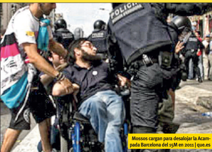
Mossos cargan para desalojar la Acampada Barcelona del 15M en 2011

sabilidades de gobierno, y es que lo dicho de los Mossos es más que aplicable a la Policía Nacional o la Guardia Civil, que son quienes se encargan de ejecutar las órdenes de aquéllos. ¿O acaso ya no recordamos actuaciones como la toma de los pueblos de las cuencas mineras en 2012 por las protestas del carbón, la represión que se ha desatado en Murcia por la protesta vecinal ante unas obras que parten en la ciudad sin consultar a la gente, similar a la ejercida contra el barrio de Gamonal en Burgos? Por no hablar