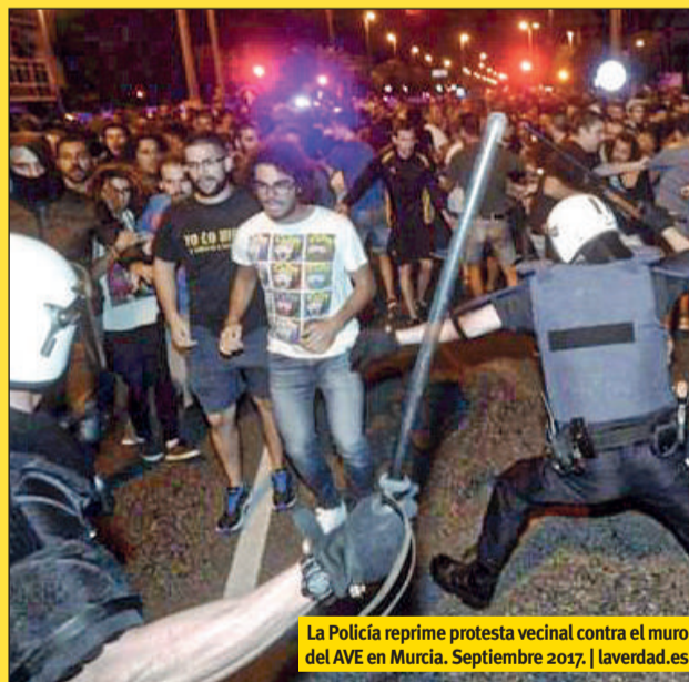
La Policía reprime protesta vecinal contra el muro del AVE en Murcia. Septiembre 2017.

Los caballos negros son. Las herraduras son negras. Sobre las capas relucen manchas de tinta y de cera. Tienen, por eso no lloran, de plomo las calaveras. Con el alma de charol vienen por la carretera. Jorobados y nocturnos, por donde animan ordenan silencios de goma oscura y miedos de fina arena. Pasan, si quieren pasar, y ocultan en la cabeza una vaga astronomía de pistolas inconcretas. 'Romance de la Guardia Civil', Federico García Lorca