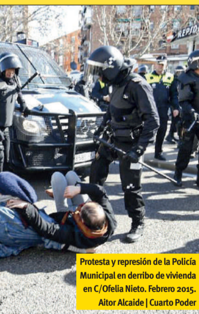
Protesta y represión de la Policía Municipal en derribo de vivienda en C/Ofelia Nieto. Febrero 2015. Aitor Alcaide | Cuarto Poder

Por último aprovechamos para denunciar la manipulación mediática y el discurso único al que estamos expuestos por parte del monopolio informativo. Invitamos a la ciudadanía a utilizar fuentes de información alternativas o, en su defecto, a tomar con prudencia y espíritu crítico el mensaje enviado por los medios mayoritarios, que no son sino creadores de opinión. ■