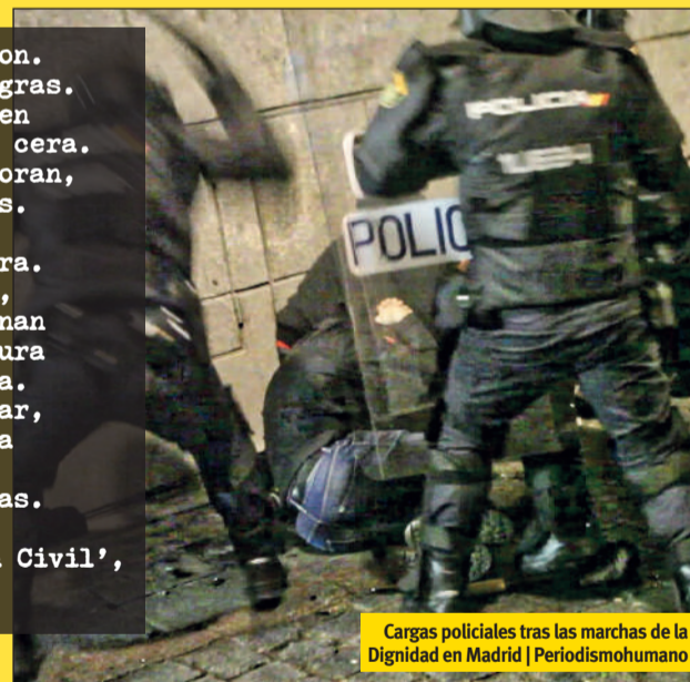
Cargas policiales tras las marchas de la Dignidad en Madrid | Periodismohumano

Los caballos negros son. Las herraduras son negras. Sobre las capas relucen manchas de tinta y de cera. Tienen, por eso no lloran, de plomo las calaveras. Con el alma de charol vienen por la carretera. Jorobados y nocturnos, por donde animan ordenan silencios de goma oscura y miedos de fina arena. Pasan, si quieren pasar, y ocultan en la cabeza una vaga astronomía de pistolas inconcretas. 'Romance de la Guardia Civil', Federico García Lorca