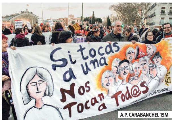
A.P. CARABANCHEL 15M