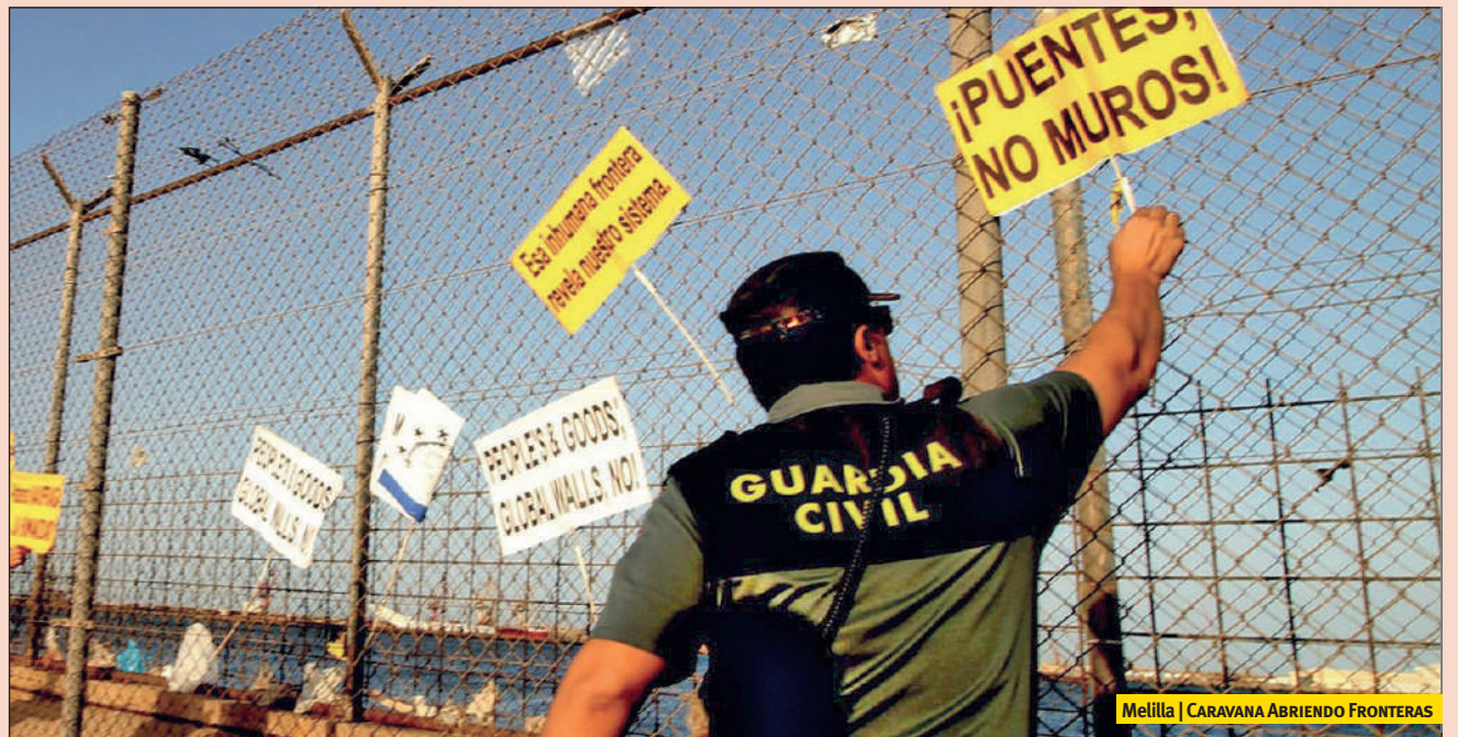
Melilla | CARAVANA ABRIENDO FRONTERAS

Las razones que nos habían llevado a elegir Melilla como símbolo de la “Europa fortaleza” en la que vivimos se nos hicieron patentes en cuanto pisamos la ciudad. Melilla es claustrofóbica: está rodeada por 12 kilómetros de valla, un monstruoso complejo de 6 metros de alto custodiado por un enor-