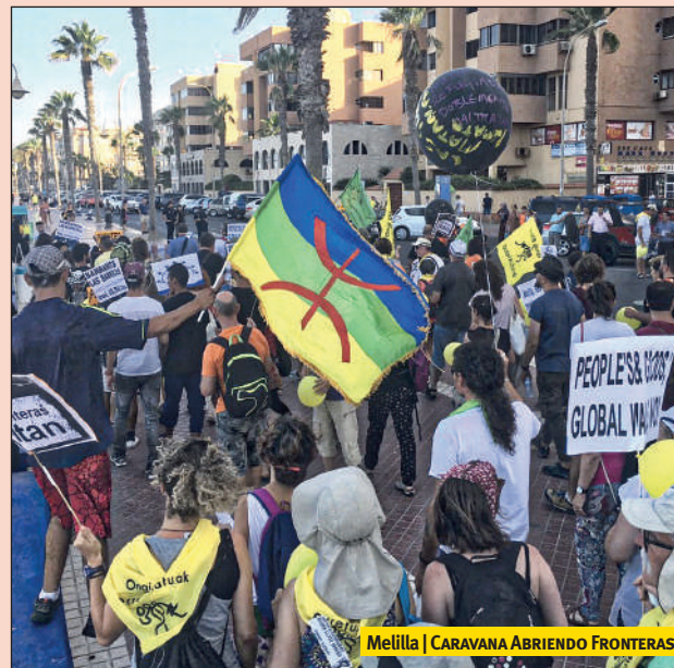
Melilla | CARAVANA ABRIENDO FRONTERAS

La Caravana Abriendo Fronteras viajó este verano a