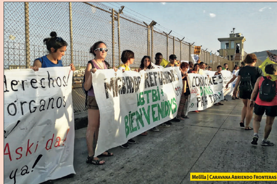
Melilla | CARAVANA ABRIENDO FRONTERAS

En Melilla pudimos compartir nuestro tiempo con algunos de los niños que malviven en la calle (hay cerca de 500 menores no acompañados —MENA— en la ciudad, de los cuales unas decenas viven en la calle), niños que viven de espaldas a las Administraciones, hasta el punto de que la asistencia sanitaria se les niega, un problema que algunas de nuestras compañeras pudieron enfrentar haciendo acompañamientos médicos. Conocimos las terribles condiciones en las que trabajan las porteadoras, mujeres que cargan enormes fardos de mercancías sobre sus espaldas de un lado a otro de la frontera y que soportan cada día no solo ese peso, sino también la violencia policial, los aplastamientos en el paso fronterizo y el ago-