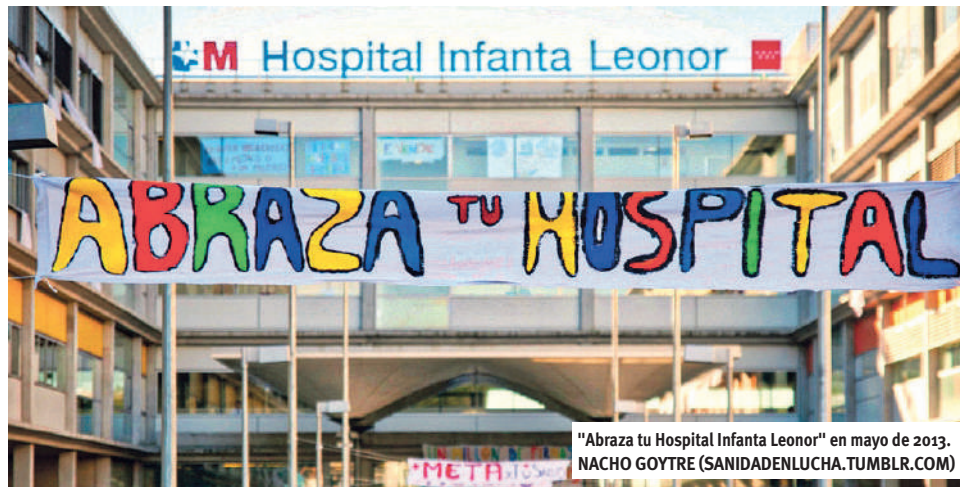
"Abraza tu Hospital Infanta Leonor" en mayo de 2013.

La Marea Blanca, convocada por la Medsap (Mesa en Defensa de la Sanidad Pública de Madrid) desde el 2012, sale a la calle los terceros domingos de mes en Madrid a denunciar el desmantelamiento y privatización de nuestra sanidad pública. La Marea Blanca, además de las manifestaciones/concentraciones en el Ministerio de Sanidad, este año 2017 está acudiendo a los barrios a denunciar situaciones concretas de falta de recursos, de atención, de mantenimiento e intentos de desmantelar servicios sanitarios en los hospitales públicos. Ya ha acudido al Ramón y Cajal, Gregorio Marañón, La Princesa y el Hospital de Móstoles.