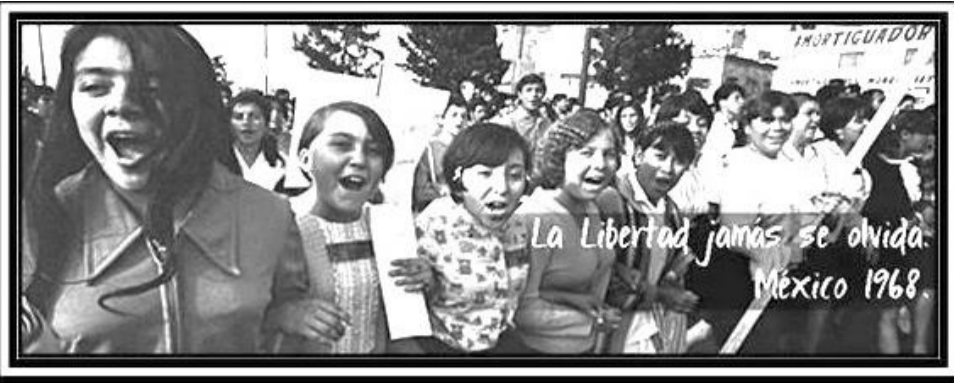
Doroteo Arango, La Voz del Anáhuac, Julio-Agosto de 2018.

En estas fechas se cumplen ya 50 años del Movimiento Estudiantil-Popular de 1968. Pero ¿cómo comenzó todo?