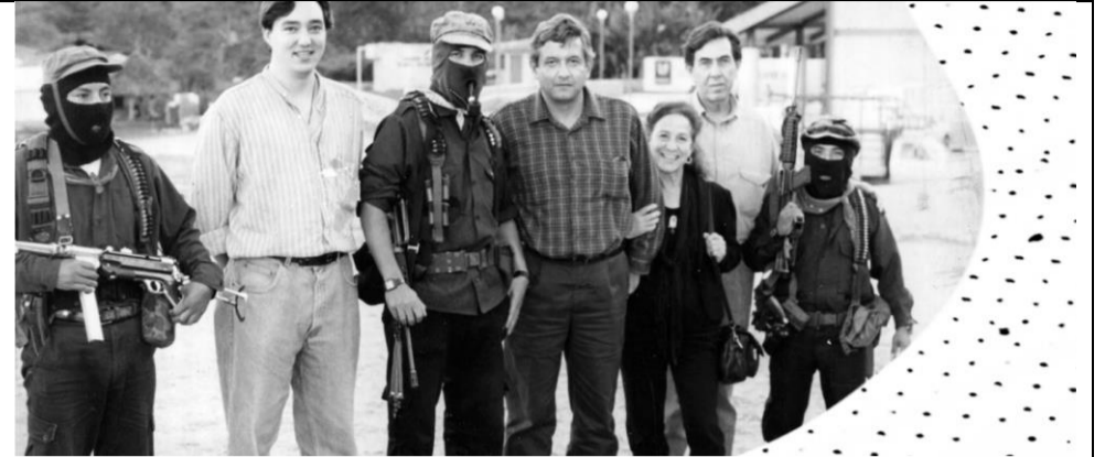
Texto de: FilosoFlow