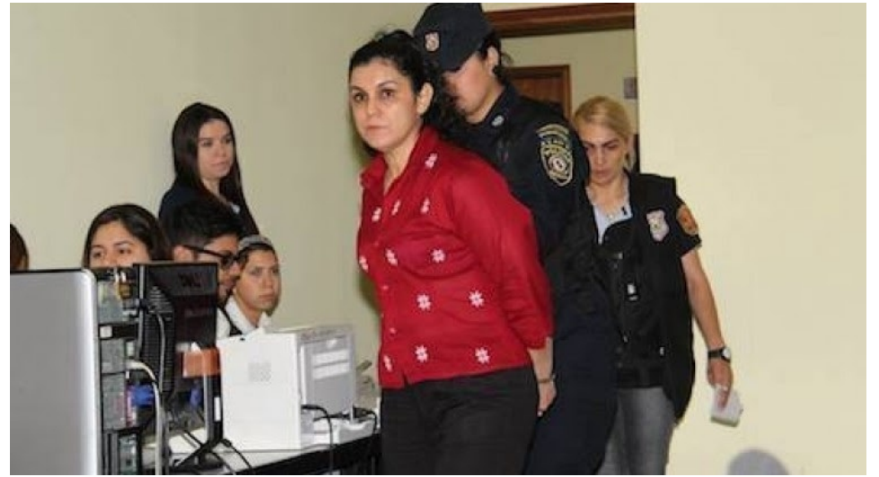
“Una revolucionaria comunista no puede ser pesimista.”

-Sin ninguna duda, para un revolucionario/a su existencia se halla insertada en la lucha misma, dónde se encuentre debe luchar, no hay lugar para los acomodados. Me resulta muy difícil asumir una posición indiferente ante el sufrimiento y lucha de mi clase, sin importar la