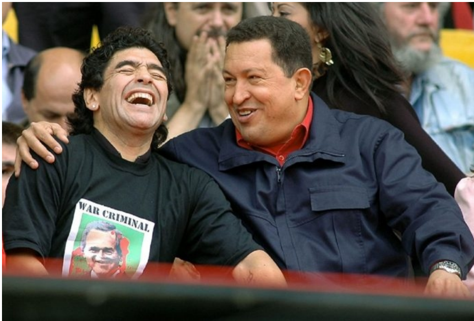
Maradona y Hugo Chávez, contra el ALCA en Mar del Plata.