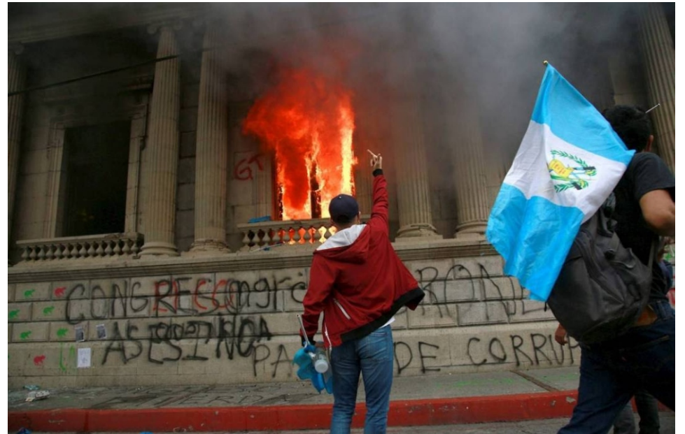
El hartazgo popular estalló en ira contra la institucionalidad burguesa.

2020, estado de la cuestión. En el haber, el acumulado para un nuevo ciclo masivo de movilizaciones, que aporta en la medida en que las actorías nuevas y las tradicionales confluyan, dialoguen y generen acciones comunes, desde las diversidades , con la capacidad de prever