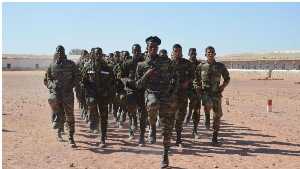
Soldados saharauis entrenándose en los campamentos para ir a la guerra.

Vaya por delante que no pretendo hacer un canto gratuito a la guerra, ni mucho menos. El solo hecho de ser Saharaui ya me impide pregonar loas a la guerra, ya que todos los saharauis en menor o mayor medida hemos sufrimos los estragos de la guerra con la pérdida de algún ser querido. Lo que nadie puede poner en cuestión es el derecho a la defensa de un pueblo que día tras día son atropellados de forma impune sus derechos más elementales. Y sobre todo cuando le han sido negados de forma reiterada el ejercicio de esos legítimos y sobradamente reconocidos