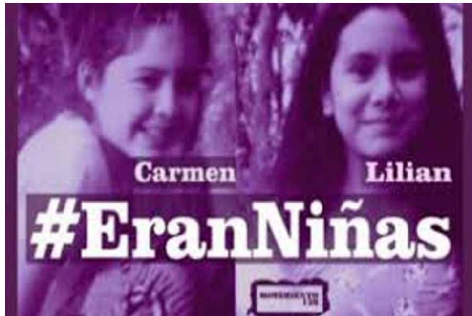
"¡Son niñas!": Un crimen de lesa humanidad que deberán pagar.

hicimos denuncia en los organismos internacionales como el Comité de Niños de Ginebra, las Naciones Unidas, estamos presionando para que entre el Equipo Antropológico y se sepa realmente que hicieron con nuestras niñas.