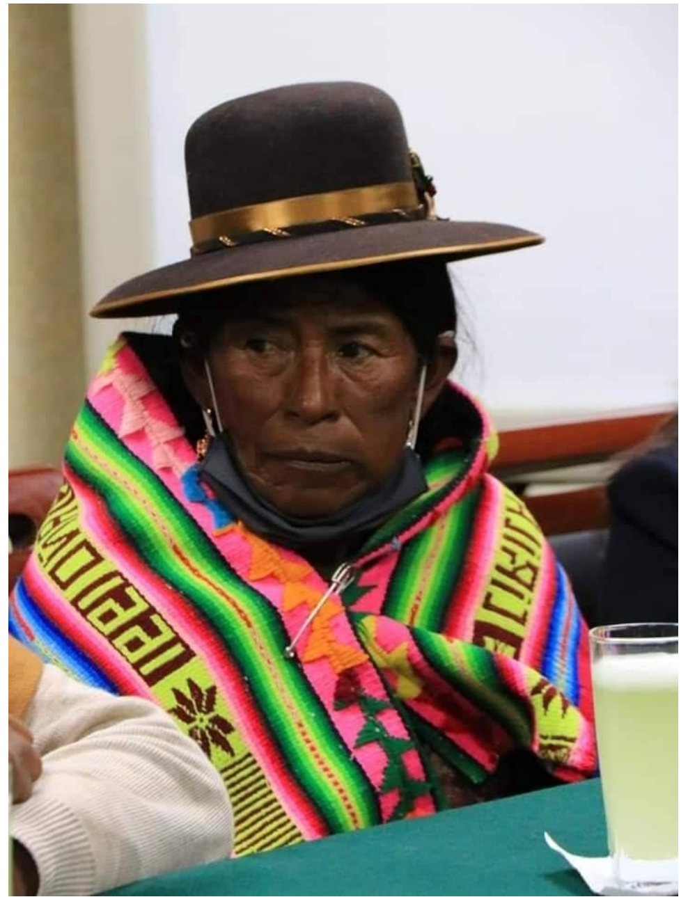
La Bolivia indígena pide pista y no está dispuesta a más postergaciones.

Las acciones de los grupos de ultraderecha no se reducen a declaraciones, bloqueos o rezos. Aún desconociendo a los autores materiales e intelectuales, la noche del 5 de noviembre, es decir, una semana después de los comicios electorales, se registró una explosión en la sede de campaña del Movimiento Al Socialismo en La Paz, mientras el entonces candidato electo Luis Arce se encontraba adentro.