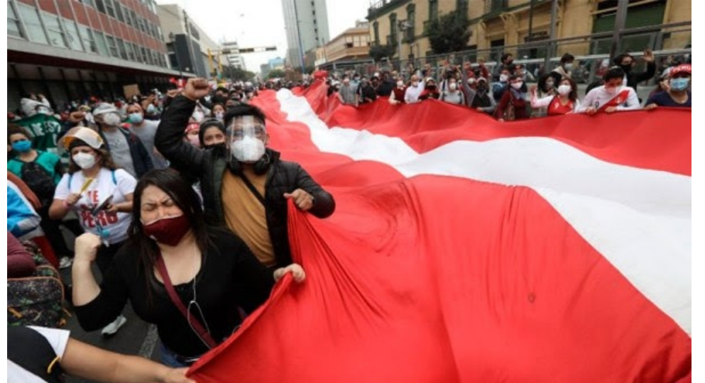
La rebelión juvenil puso contra las cuerdas a la democracia inservible.

Apenas surgió la idea de una nueva Constitución en alguna de las marchas, los defensores de la "sagrada Constitución fujimorista de 1993" pegaron el grito al cielo: todo menos cambiar una coma de esa carta magna que sería la base del milagro económico que corre en cuerda separada de la democracia política terminal y de la vergüenza de la profunda desigualdad mostrada en sus paños menores por la pandemia. No hay que tocar la Constitución,