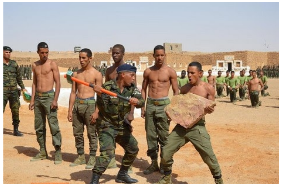
Miles de voluntarios se alistaron en el Ejército Popular Saharaui.