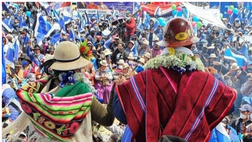
"No queremos racismos, ni oligarcas ni exclusión"

Aunque la ultraderecha y sus grupos paramilitares buscaron impedirlo por todas las vías posibles, Luis Arce Catacora asumió la presidencia de Bolivia y Evo Morales dejó el exilio para volver a casa.